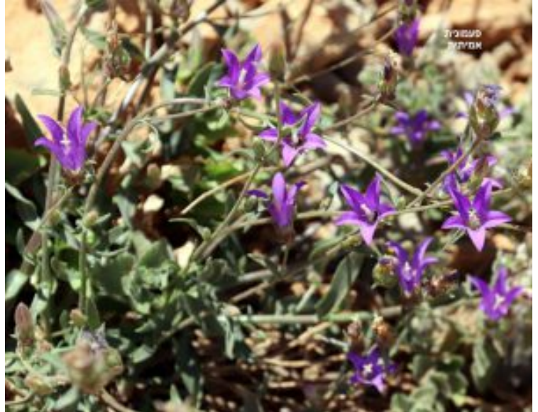
מימין: צמח פעמונית אמיתית שרוע במדרון. משמאל: צמח בשיא פריחה. להגדלה - לחצו על התמונה.

הפרחים דו מיניים, גדולים (1.5 ס"מ), בולטים בצבעם הסגול. לפרח צורת פעמון הנישא על עוקץ קצר. 5 עלי לואי קצרים ורחבים, יושבים בדור מתחת לגביע וחופנים את בסיסו. חמשת עלי הגביע מאוחים בבסיסם ומתפשקים ל- 5 שיניים רחבות המסתיימות בקצה מחודד. 5 עלי הכותרת, מאוחים בחלקם התחתון לצינור בעל 5 שיניים מופרדות וארוכות, ויוצרים צורה של פעמון. לעיתים בסיס צינור הכותרת זרוע שערות דקות לבנות. 5 אבקנים הזירים קצרים מהמאבקים. המאבקים מוארכים, אנכיים לעלים והלשכות צמודים אליו. עם הבשלתן הן מעמיסות גרגירי אבקה על גוף עמוד העלי (שלא בשל עדיין) והוא נצבע לבן. לאחר מכן, מתפשקים האבקנים לכיוון בסיס הכותרת ומפזרים את האבקה שמותרה. צבע הלשכות משתנה לצהוב חום, הן מצטמקות ומתייבשות. השחלה תחתית בת 3-5 מגורות המבשילה לאחר האבקנים. עמוד העלי מתארך ומציג לראווה צלקת בהירה בת שלוש אונות מאוזנות. הבשלת אברי המין שאינה באותו זמן, מטרתה לזנוע האבקה עצמית בפרח.