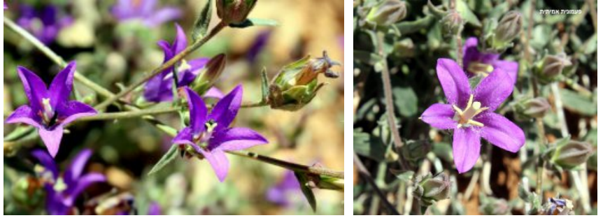
מימין: שלב הבשלה זכרי בפרח. באמצע: פרחים מואבקים ע"י חרקים. משמאל: השלב הנקבי, העלי מצמיח צלקות. להגדלה - לחצו על התמונה.

האבקה נעשית ע"י חרקים. דבורים וחרקים אחרים אשר פוגשים בצלקת גבוהה, הבולטת בפרח. אם ביקרו כבר פרחים אחרים והם נושאים על גופם גרגירי אבקה, נוצרת האבקה ולאחריה הפרייה. הפרי המתפתח הוא הלקט כ-0.5 ס"מ, צורתו חרוטית, נפתח בנקבים. הזרעים עגולים קטנים ביותר המתפזרים מגוף ההלקט ע"י תנועתו ברוח. פעמונית אמיתית פורחת בחודשים יולי - אוקטובר.