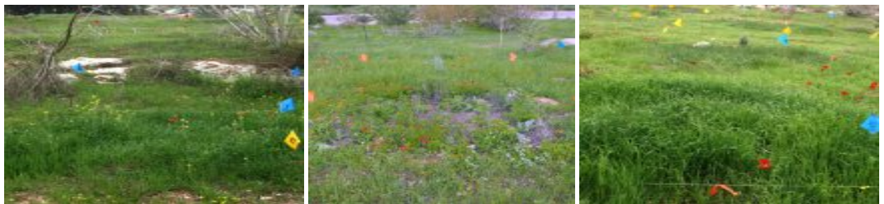
איור 2. חלקות הניסוי. מימין - חלקה מדושנת; במרכז - חלקה מרוססת; משמאל - חלקת ביקורת להגדלה - לחצו על התמונות

ה"ביקורת" הייתה חלקה מזווגת (חלקה קרובה המאופיינת בתנאים דומים) שבה התבצעה מניפולציה של סילוק הדגניים בעזרת ריסוס סלקטיבי לאחר הנביטה בחודש דצמבר (איור 2). השוואה בין הביומסה של רחבי עלים בחלקה ללא ריסוס ביחס לחלקה המרוססת המזווגת לה, מאפשרת לאמוד את עוצמת התחרות (המוגדרת כלוגריתם היחס בין ביומסת רחבי-עלים ללא תחרות בין ביומסת רחבי-עלים בטיפול הביקורת). במהלך עונת הגידול נערכו מדידות אור בגבהים שונים מעל פני הקרקע לשם הכימות של רמת האסימטריות בקליטת האור. ככל שהשוני בקליטת האור בין מינים נמוכים וגבוהים גדול יותר, כך האסימטריות גבוהה יותר (כימות האסימטריות נעשה באמצעות אומדן של השיפוע של עוצמת האור כפונקציה של הגובה בכל אחת מהחלקות). בסוף מרץ (שיא הביומסה) נאספו כ-4 דגימות צומח שנקצרו משטחי מדגם של 20×20 ס"מ מכל חלקה ובכל אחת מהן נרשמו במעבדה מיני הצמחים (הניתוח הסטטיסטי התבסס רק על המינים החד שנתיים שצפויים להגיב לרמת האסימטריה ועוצמת התחרות שנמדדה באותה שנה).