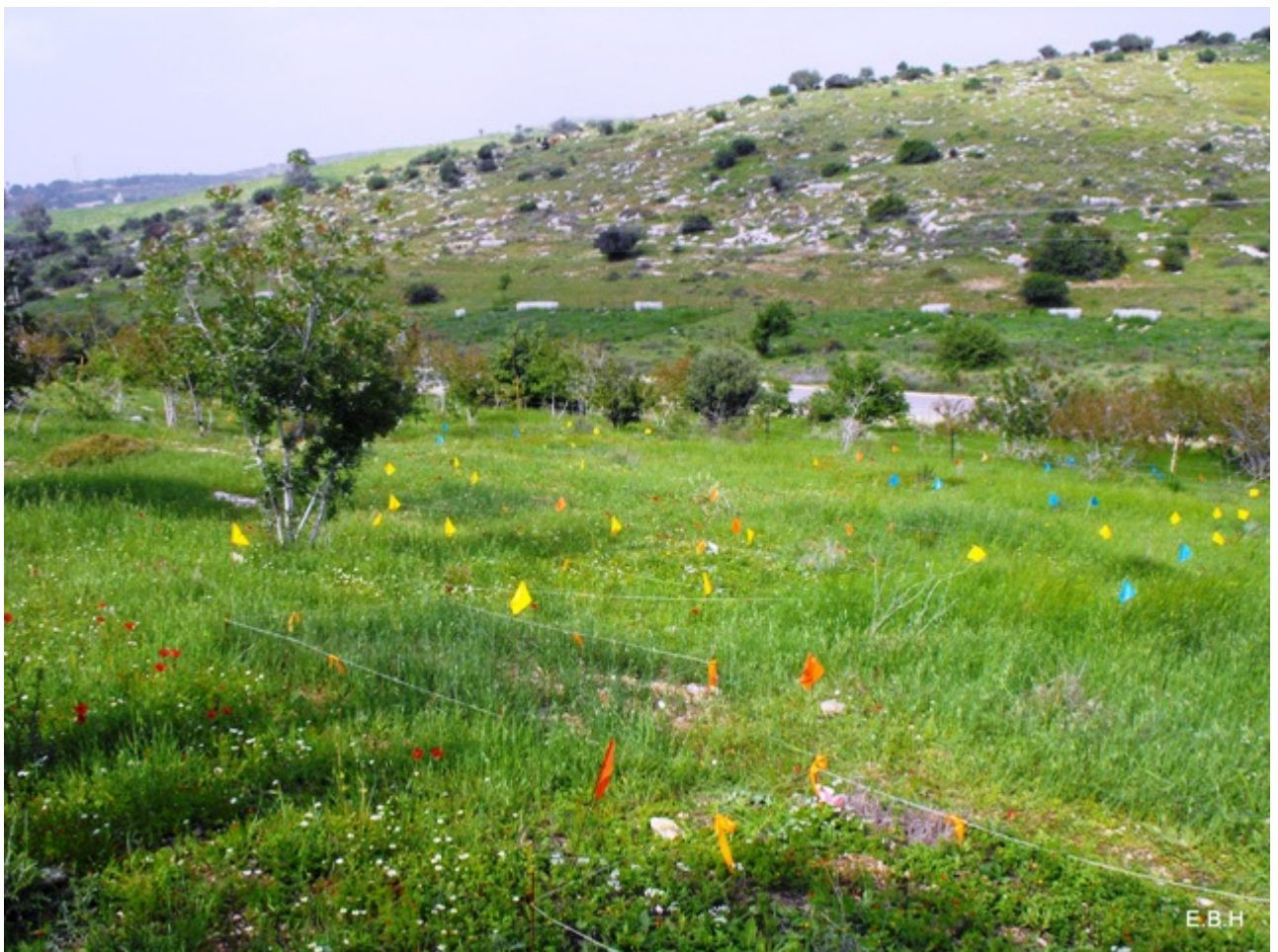
איור 1. אסימטריות האור ודחיקה תחרותית של צמחים - מערכת הניסוי בבית גוברין.

מדרון שמאופיין בקרקע רדודה, ייצרנות נמוכה ומגוון גבוה. הצומח השולט באזור הוא בעיקר חד-שנתי. המינים הנפוצים ביותר באזור הם דגנים גבוהים ( שעורת התבור ושיבולת-שועל נפוצה ) אך עיקר המגוון במערכת הוא של מינים רחבי עלים הכוללים פרפרניים מקבעי חנקן (מיני שונים של תלתן, אספסת, קדד, טופח, אפון וביקיה ), מינים בעלי שושנת עלים (למשל כוכבן מצוי, שופרית כרתית, מיני ניסנית, לפתית מצויה, חרחבינה מכחילה, מצלתיים מצויים, דרדר גדול-פרחים, מיני לחך ) ומינים נוספים (למשל מרגנית השדה, קחון חברוני, דמומית קטנת-פרי, מיני חלבלוב, מיני פשתה ). כמו כן בשטח פזורים גם מעט מינים רב שנתיים, רובם גיאופיטים ( כלנית מצויה, איריס ארץ-ישראלי נורית אסיה, זהבית השלוחות, שום האבקנים, נץ-חלב הררי, בן-חצב סתוני, דבורנית צהובה ).