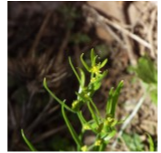
מציאות בהשתלמות החרמון

מימין לשמאל - זהבית הבצלצולים. יואב רמון ©; פעמונית הצלצל. ערגה אלוני ©; בן-חרצית צפוף. ערגה אלוני ©; הרקלאון נמוך. שמואל מזר © להנדלה - לחצו על התמונות