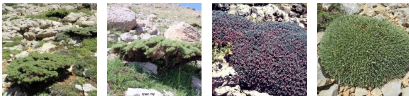
בני שיח כר-קוציים אופייניים לחרמון מימין לשמאל - חדעד הלבנון. אבי שמידע ©; קדד אדום-פרחים. עוז גולן ©; קדד חרמוני. ערגה אלוני ©; קדד קיפודי. אבי שמידע © להגדלה - לחצו על התמונות

בכל שטח הדולינות בעמק בולען לא גדל אפילו עץ אחד על אף שבמדורות הפונים דרומה נמצא עצי עוזרר, שקד ואדר קטן-עלים ברום 2100-2000 מטר מעל גובה העמק. מדולינת הטרשים עלינו במדרון מערבי בו השלוגית נמסה רק לפני שבוע אל "צומת איריס סופרנה" ומשם חזרנו בדרך העפר מערבה אל צומת האופנוע ליד הרכבל העליון.