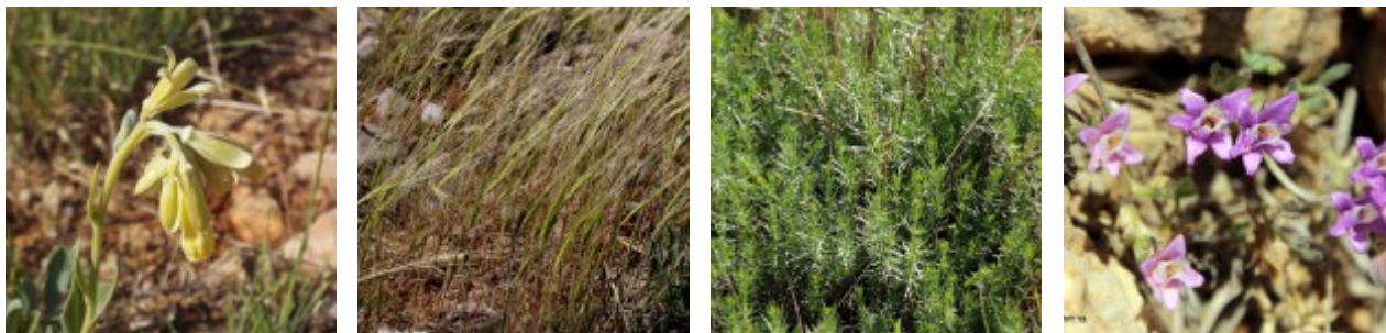
צמחים בעמק בולען מימין לשמאל - בר-דורבן פעוט. ערגה אלוני ©; דבקה אמיתית. ערגה אלוני ©; חיסת הבר. ערגה אלוני ©; סומקן המשי. יואב רמון © להגדלה - לחצו על התמונות

גדלים בעיקר במפנים דרומיים שטופי שמש. אך בדולינת הורד פגשנו על כתם חווארי ששלטו בו ורד דביק וקדד קיפודי 5 עצים של בן-חוזר לבנוני במפנה צפון-מערבי. עד כה לא היה ידוע לנו על בן-חוזר לבנוני , מין נדיר בכלל ובחרמון בפרט שגדל ברום כה גבוה ובאזור עמק בולען מעל 1850 מטר.