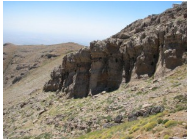
מצוק מצפה שלגים.

החרמון הישראלי מהווה בערך רק עשירית מכלל שטח החרמון, וזה מהווה רק את הקטע הקטן הדרומי ביותר בשרשרת הרי מול-הלבנון. ראינו כי לכל אורך השדרה המרכזית של רכס החרמון משתרעות כיום שלוגיות לבנות דווקא בצד המזרחי. זאת עקב הסעת השלג בסופות החורף מהצד המערבי של המדרון כך שהשלג מצטבר בצד המוגן מהרוח בדומה ל"חוליות במדבר". אין שלג עד בחרמון והשלוגיות האחרונות נמסות תמיד עד אמצע חודש אוגוסט. ערביי דמשק היו נוהגים לחצוב את השלב ברום החרמון במאות שעברו, ושיירות גמלים עם "שלג החרמון" הגיעו עד שווקי עזה בשיירות גמלים.