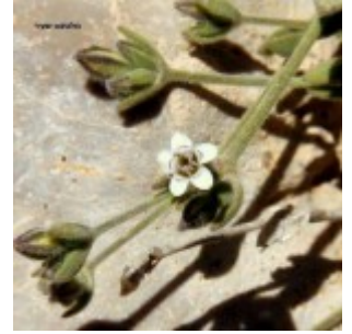
דוגמאות של צמחים מטבלה 2

מימין לשמאל - בולנתוס שעיר (דק גבעול?). ערגה אלוני ©; בוצין דמשקאי (הארזים). יואב רמון ©; חד-אבקן ארוך-פרח (אדום). ערגה אלוני ©; עכובית הגלגל זן מפורץ. ערגה אלוני ©. להגדלה - לחצו על התמונות