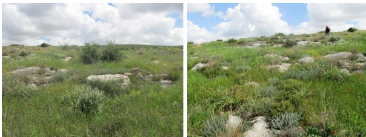
גבעות נטע - מראה כללי . להגדלה - לחצו על התמונות

נספרו מעל 120 מיני צמחים שונים משני אזורים ביוגיאוגרפיים חשובים: האזור הים-תיכוני וחגורת הספר של המזרח התיכון. הצמחים השולטים במקום הם סירה קוצנית, שמשון הדור, ומרווה ריחנית . מבין הצמחים הים-תיכוניים יצוינו: זלזלת הקנוקנות, סחלב פרפרני וציבורת ההרים - הפורחים במחצית חודש מרץ כל שנה. מבין השיחים והעצים מופיע רק אשחר ארץ-ישראלי , כאשר החרוב, אלת המסטיק ואלון מצוי מדרימים רק עד קו אמציה.