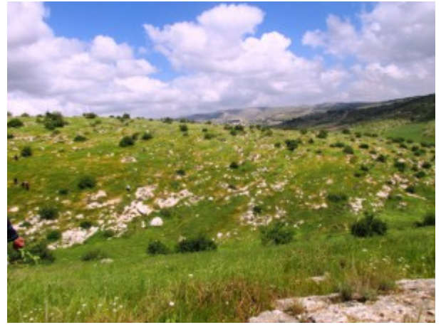
גבעת מרשם מימין - מראה כללי. צילם: גדי פולק ©; משמאל - מרבדים של מלעניאל מצוי. צילם: עוזי פז © להגדלה - לחצו על התמונות