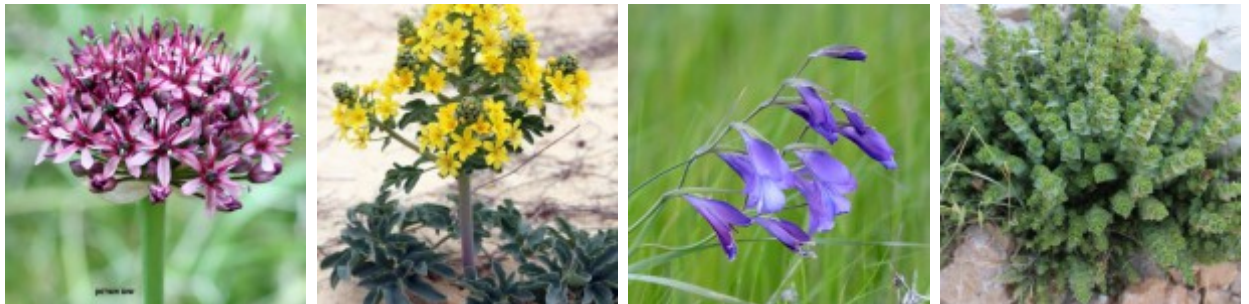
מימין לשמאל - אזובית המדבר. ערגה אלוני ©; סיפן סגול. ליאור אלמגור ©; ערטנית השדות. ערגה אלוני ©; שום אשרסון. ערגה אלוני ©. להגדלה - לחצו על התמונות