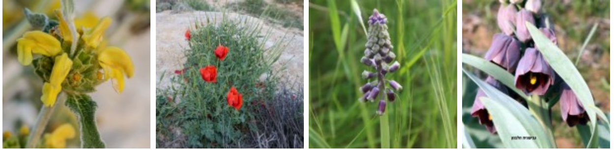
מימין לשמאל - גביעונית הלבנון "ערבית". ערגה אלוני ©; מצילות ארוכות-עוקץ זן טיפוסית. ערגה אלוני ©; פרגה אדומה. חוה להב ©; שלהבית המדבר. חוה להב © להגדלה - לחצו על התמונות