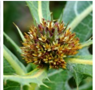
צמחים מגבעת מרשם מימין לשמאל- עכובית הגלגל. ליאור אלמגור ©; שלהבית קצרת שיניים. ערגה אלוני ©; דק-זנב קשתני. חוה להב ©; צורית חיזורת. חוה להב © להגדלה - לחצו על התמונות