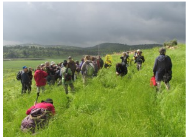
משתלמי כלנית בגבעת אשל הפרקים ליד אמציה.