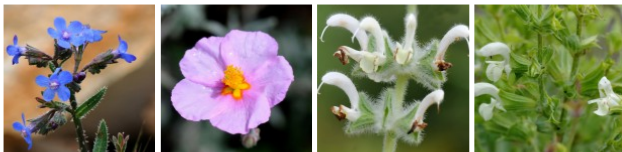
צמחים אופייניים בצמחיית הספר בגבעת נטע. מימין לשמאל - מרווה מלבינה, מרווה ריחנית, שמשון הדור, לשון-פר סמורה להגדלה - לחצו על התמונות