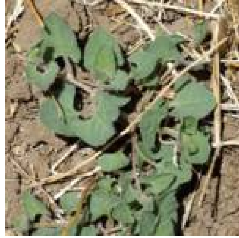
מימין: חבלבל שעיר זוחל על פני הקרקע בהעדר צמחים לטפס עליהם. משמאל: חבלבל שעיר מטפס על עצמו. הגבעולים מלופפים זה בזה.