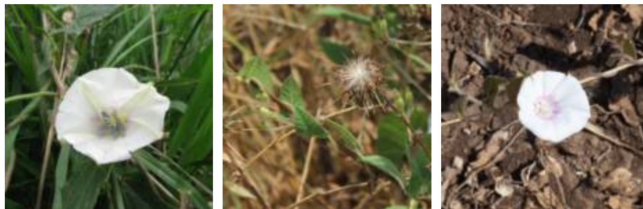
מימין: חבלבל שעיר - פרח. כתם ורדרד רדיאלי סביב מרכז הכותרת. באמצע: חבלבל שעיר מטפס על גדילן מצוי. גבעול החבלבל מסתלסל סביב גבעול הגדילן. משמאל: חבלבל שעיר, תמונת בול.

חבלבל שעיר מתחיל לפרוח באביב (בסביבות חודש מרץ), ומסיים לפרוח בסוף האביב או במהלך הקיץ (במהלך החודשים יוני עד אוגוסט) בתלות בלחות הקרקע בתקופה זו.