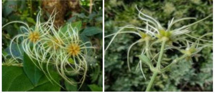
מימין ובמרכז - פירות של זלזלת היערות; משמאל - פירות של זלזלת מנוצה. פרודות הפרי של ז. מנוצה פחוסות בעלות חישוק מוקשה בהיקף ואילו פרודות הפרי של ז. היערות מעוגלות וחסרות חישוק מודגש בהיקפו. (ז. היערות צולמה בסטאף, ז. מנוצה צולמה ביערה). להגדלה - לחצו על התמונות

פוסט נותן בפלורה של הלבנט (Post, 1932) את שני המינים, זלזלת מנוצה וז. היערות מסוריה ולבנון; הוא מציין את ההבדל בצורת הפרי. לפי פוסט, זלזלת מנוצה פירות עם שוליים מודגשים מאוד ואילו זלזלת היערות לא - סימן זה מאוד בולט בהשוואה שביצענו בין זלזלת מנוצה ל זלזלת היערות . פוסט נותן סימנים נוספים ל זלזלת היערות - שעירות על העלים, במיוחד על העורקים (ולא רק בעלים הצעירים), ובנוסף הוא מציין את העלים הרחבים-משוננים והשעירות משני צידי הכותרת. מפתיע הדבר שפוסט מציין ששני המינים, זלזלת מנוצה ו זלזלת היערות , נמצאים בפלשתינה. זלזלת היערות צוינה על סמך רישום של טריסטרם מהגלעד. מעניין כי בפלורה פלסטינה זהרי (1966) לא התייחס לרישום של טריסטרם, כנראה בעקבות טעויות בוטניות בסיסיות של טריסטרם שהיה חוקר בעלי החיים החשוב של ארץ ישראל במאה ה-19.