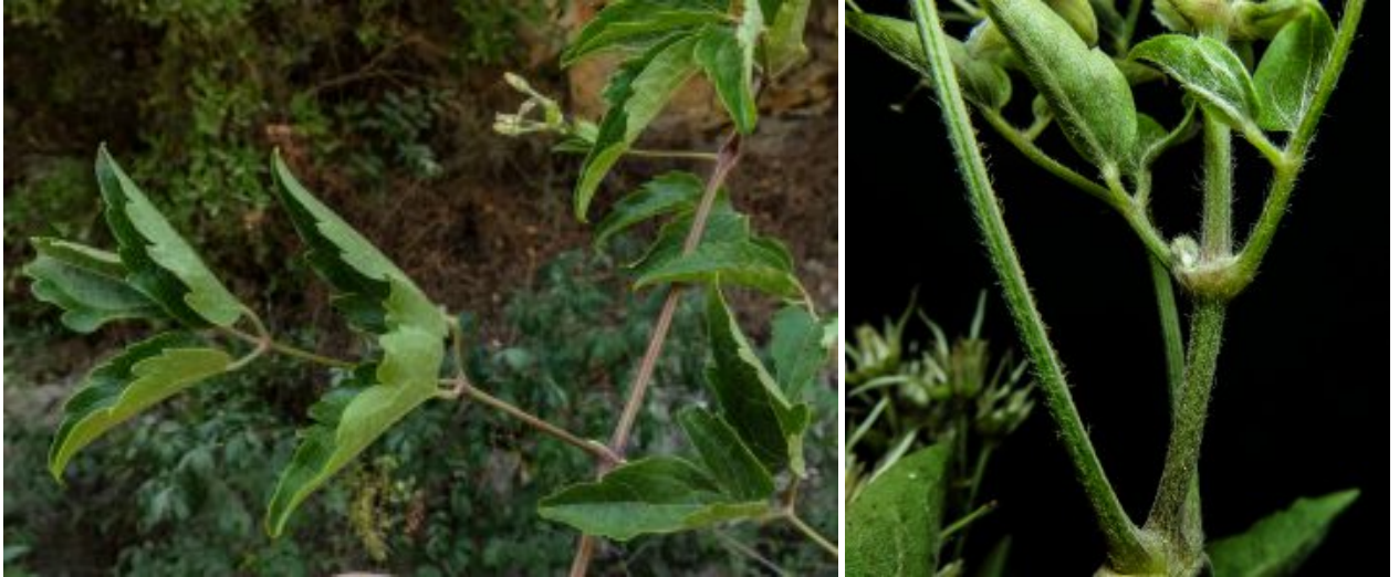
זלזלת היערות - עלים וגבעולים. 1.8.2018 בסטאף, הרי ירושלים. להנדלה - לחצו על התמונות

סקירה בספרות הראתה שבמזרח הים-התיכון, כולל בלבנון, ידועים שני מינים קרובים של זלזלת הפורחים בחודש מאי (ולא כמו זלזלת הקנוקנות בחודשי דצמבר-ינואר): זלזלת מנוצה ( Clematis flammula ) ו זלזלת היערות ( Clematis vitalba ). כל הסימנים הללו שתוארו לזלזלת של הסטאף מוזכרים בספרות המדעית כסימנים המאפיינים את זלזלת היערות .