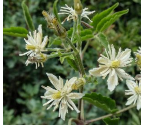
מימין - זלזלת היערות בסטאף, הרי ירושלים, 1.8.2018. שתי תמונות משמאל - תפרחת זלזלת היערות לעומת תפרחת ז.מנוצה, (ז.היערות צולמה בסטאף, ז.מנוצה צולמה ביערה). להבדלה - לחצו על התמונות

בחינה מדוקדקת יותר של הפרטים מהסטאף הראתה הבדלים מהותיים נוספים המבדילים אותה מזלזלת מנוצה. הכותרת קטנה יותר ושעירה משני צדדיה (ולכן חסר הלובן המבריק), המאבקים קצרים (בהשוואה לזלזלת מנוצה שלה מאבקים מאורכים), וכן הענפים הצעירים הירוקים היו שעירים. גם צורת העלים הייתה שונה. בעוד שלזלזלת מנוצה עלה מנוצה פעמיים בעל עלעלים קרחים חלקים, הרי שבזלזלת של הסטאף העלה מנוצה רק פעם אחת והעלים לרוב רחבים ומשוננים.