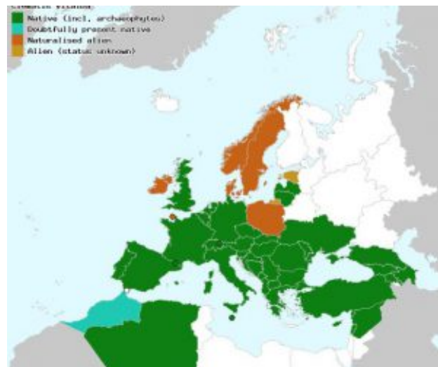
מימין - מפת התפוצה של זלזלת היערות משמאל - מפת התפוצה של זלזלת מנוצה

קיימת משמעות גדולה בנוגע לשמירת טבע - האם זלזלת היערות היא מין נדיר בישראל או שמא הוא מין נפוץ שפשוט לא הבחנו בו. רק מחקר מסודר של אוכלוסיות הזלזלת בישראל יאפשר מיפוי של זלזלת היערות וזלזלת מנוצה בישראל. בכל אופן, זלזלת היערות היא מין בר חדש לישראל. אנו ממליצים לבקר בתחילת חודש מאי בחניון התחתון של הסטאף בהרי ירושלים, ללכת צפון מזרחה לאורך דרך העפר במקביל לנחל שורק וליהנות מפריחה שופעת של זלזלת היערות המטפסת על עצי החורש.