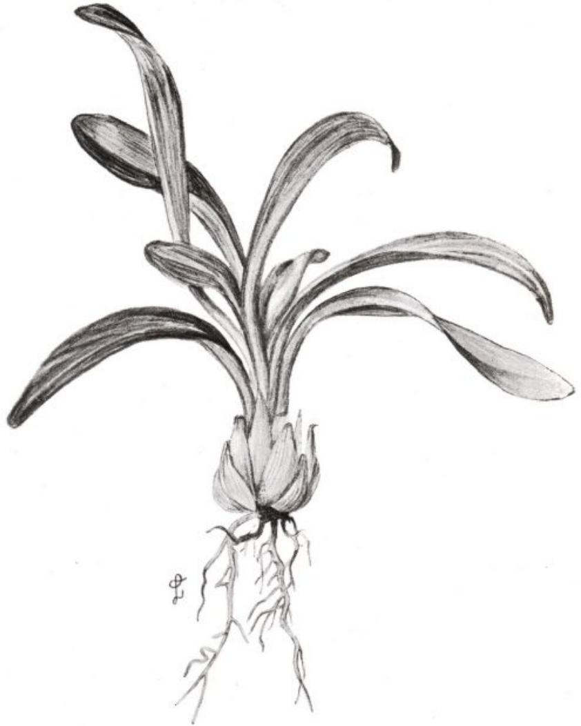
צויר 964 שושנת-הטלך - Lilium candidum , L.