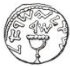
צויר 966 שקל ישראל וירושלים הקדושה מסבב של שיעון התשס"א.

בהנ"ל אליל ג"א הר"ד (141 לקני ספירת הנוצרים) התאספו וקני ישראל, הבהגים וכל העם, לאספה גדולה בתער היה האלהים בירושלים והכירו את שיעון התשס"א לכהן גדול, אשר צבא ישראל ולנשיא העם. הנביע הוא סמל קדוש הקספל כנרצה, את הנסוד קבית המקדש. בעד השני מספלת "שושנת-הטלך" את טלכות ישראל. הדתכות הן בקרב העברי התרבות הנקרא קפי סכטי הפלמוד דשם "קמב רועץ" (קמב חליו).