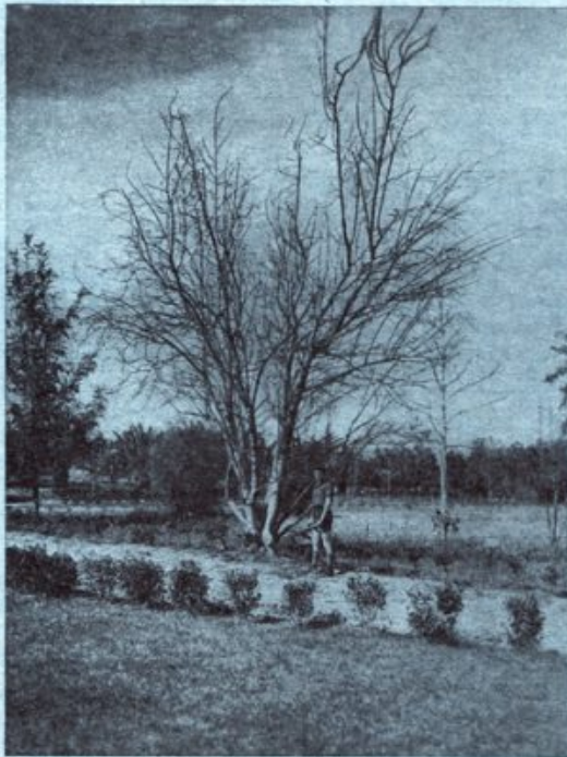
Moringa aptera, Gaertn. — עץ בינה (בשלקת, כגון הבוקני בסקודה-ישראל) אחד מן הצמחים החשובים סביביה משקית והעשיתית. אנרד קארין. גיל בר דאסק סירבו