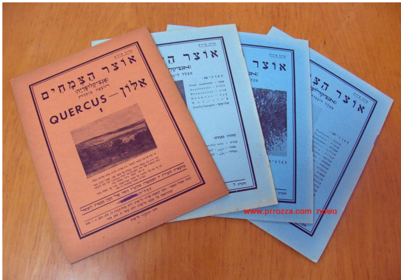
חוברות אוצר הצמחים מאת ברוך צ'יז'יק

שחיבר על צמחי ארץ ישראל. בשנת 1937 פרסם את המונוגרפיה "צמחי הדלועיים", ושנה לאחר מכן, בשנת 1938 החל במפעל חייו האדיר - "אוצר הצמחים". בשנים הראשונות יצאו לאור חוברות, כל חוברת בת 16 עמודים, בהן נמסר מידע מקיף על הצמחים, שהופיעו על פי סדר הא'-ב' של שמותיהם.