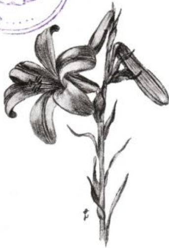
צויר 965 שושנת-הטלך על גזעיה ופרחיה.