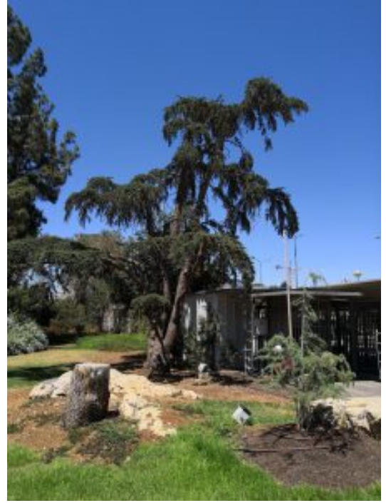
מימין: ארז הלבנון, פתח גבעת-רם 1.7.19. צילם א. שמידע © משמאל: ארז הלבנון, הר-גילה 8.8.19. צילם א. שמידע © להגדלה - לחצו על התמונה.

ומדוע ארז הלבנון המפורסם של פתח גבעת רם איננו עושה אצטרובלים? ישנו מיתוס הידוע בעיקר מעצי אורן, שעצים לפני מותם מייצרים הרבה פירות אצטרובלים. דעה זו נובעת מהעובדה שאצטרובלי אורן ירושלים אינם נופלים וכאשר העץ נוטה למות, רוב עליו נושרים ואצטרובלים בני עשרות שנים נגלים לצופה. הסבר שיותר מתאים לעובדות בטבע, הוא שעץ מחטני זקן מפסיק לייצר פרי כיוון שהוא חלש, ואכן עץ הארץ שבתמונה ייצר פירות לרוב מאז שנות ה-70 של המאה הקודמת ועד לפני ארבע שנים.