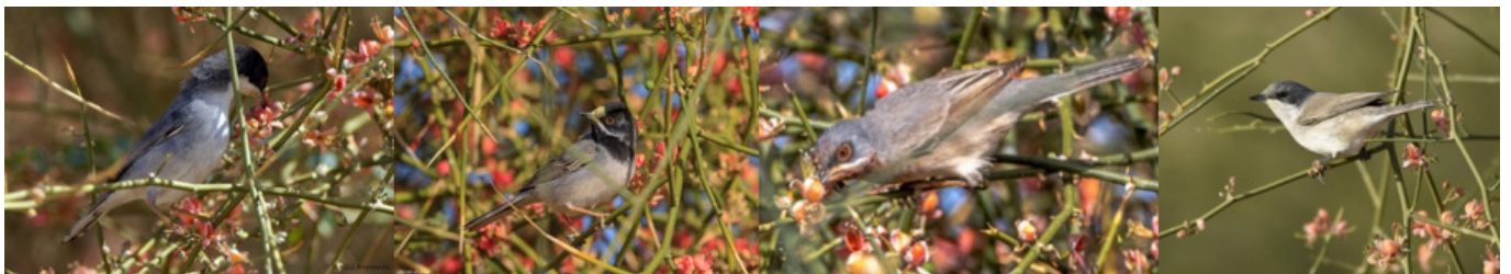
סבכיים מבקרים בשיחי צלף רותמי, מימין לשמאל: סבכי טוחנים, סבכי רונן, סבכי שחור-גרונן, סבכי שחור-ראש

תקציר: ברשתות החברתיות ובאינטרנט, ראיתי כי הצלף הרתומי - Capparis decidua מאובק ע"י מיני ציפורים מהסוג סבכי - Sylvia , בנוסף על המאביק הידוע המופיע בספרות - דבורים גדולות.