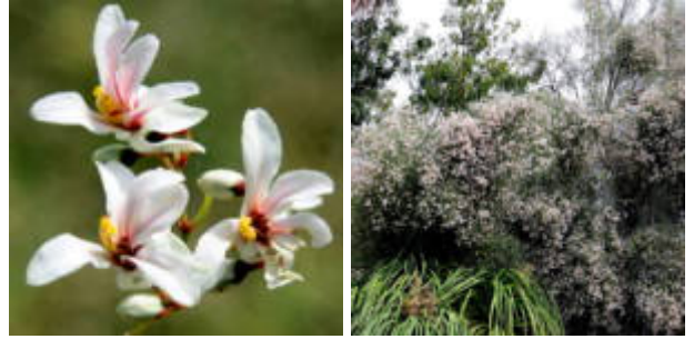
פריחה של מורינגה רותמית בקיבוץ עין גדי, 10.4.20, צילמה ענת רז ©