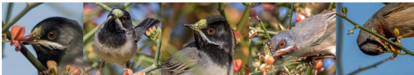
מיני סבכי מוצצים צוף מפרחי צלף רותמי צילום וסבכי שחור-גרון בעל כתם אבקה על מצחו. מימין לשמאל: סבכי רונן (מאיר לוי ©), סבכי שחור-גרון (שלומי שמאי ©), סבכי שחור-גרון (מיקי ללום ©), סבכי שחור-גרון (מאיר לוי ©). בחלק מהתמונות ניכר המגע בין האבקנים והגינפור למצחו של הסבכי.

שיא נדידת האביב של מינים מהסוג סבכי - Sylvia מאתרי החריפה באפריקה לאתרי הקינון באירופה ואסיה, מתרחש בחודשים פברואר - אפריל בהתאם למין (אתר הצפרות הישראלי), במקביל לזמן שהצלף הרותמי עומד בשיא פריחה. בתמונות המצורפות (שהן מעט מתמונות רבות שניתן לראות ברשת או בתצפית בשטח) ניתן לראות סבכים ממספר מינים, מיעוטם יציבים (סבכי שחור ראש) ורובם ממינים נודדים - סבכי טוחנים, סבכי רונן וסבכי שחור גרון , כאשר האחרון הוא הנפוץ והבולט ביותר על שיחי הצלף. בשטח ראיתי כי הסבכים ניגשים לפרחי הצלף , דוחקים את הראש לתוך הפרחים ושותים את הצוף הנמצא בפרח, בשלב זה האבקנים והגינפור נוגעים בפניו של הסבכי, בד"כ במצח, והאבקנים צובעים את מצחו בצבע צהוב בולט, עד כדי כך שלעיתים קרובות נראים פרטים סביב הצלפים עם כתם האבקה.