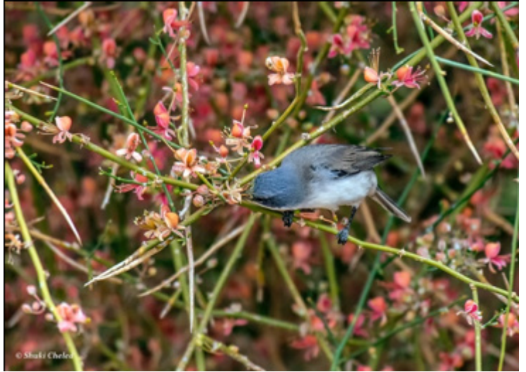
סבכי טוחנים מבקר בפרחי צלף רותמי, 8.4.2020, עין-גדי