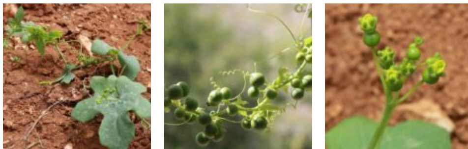
דלעת-נחש רבת-עלים Bryonia multiflora , צמח נקבי מאזור רכבל תחתון, צילם י.יחיאלי © העלה של ד.נ.רבת-פרחים מאונה קלות לעומת ד.נ.מצויה בה אונות העלה עמוקות מאוד. במרכז: פרט נקבי בפריה; קוטר הפירות של ד.נ. רבת-פרחים קטן מזה של ד.נ. מצויה ומספר הפירות בתפרחת רב יותר. צילם י.יחיאלי ©

ד.נ.רבת-פרחים ? הנושא טרם נבדק במחקר כמותי בשדה וטרם נעשה מחקר גנומי. עד אשר יעשה אנו מעדיפים להגדיר את קומפלקס דלעת-נחש בעלת העלים המחולקים לשני טקסונים: דלעת-נחש מצויה במעונות הנמוכים לעומת דלעת-הנחש רבת-פרחים בחרמון הגבוה. בהזדמנות זו ובצפיה לשלום נבדוק גם את המין האנדמי להר-הדרוזים Bryonia lasiocarpa Mouterde אשר יש הכוללים אותה בתוך המין ד.נ.רבת-פרחים.