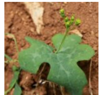
דלעת-נחש רבת-פרחים Bryonia multiflora , צמח נקבי שגדל ליד המוצב טלטל ברכבל תחתון, למרגלות הר בזבז ברום 1642 מטר, פרח בסוף חודש מאי, במרכז: איור דלעת-נחש רבת-פרחים מתוך הפלורה של עירק (Townsend and Guest 1980) בה נראים העלים המאובנים קלות לעומת ד.נ. מצויה בה אונות העלה עמוקות מאוד.

עד כה היו ידועים בישראל רק שני מינים, של הסוג דלעת-הנחש Bryonia השייך למשפחת הדלועיים, שניהם מטפסים עשבוניים של החורש הים-תיכוני ושטחי שיחיה פתוחה - דלעת-נחש סורית וד.נ.מצויה . קל להבדיל בין שני מינים אלה; בעוד ל דלעת-הנחש הסורית עלים שלמים הרי ל דלעת-הנחש המצויה עלים מחולקים כעין כף יד ל 5-7 אונות עמוקות (ראה ד.נ.סורית-מצויה תמונות). והנה באביב של שנת 2017 בטיול שערכנו למרגלות הר שקד בקרבת רכבל תחתון, פגשנו מטפס עשבוני המשתרג על ענפי האלונים