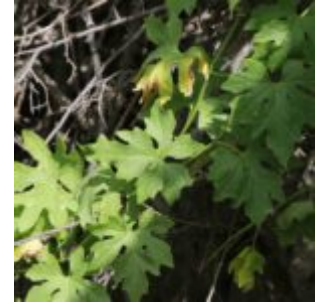
דלעת-נחש רבת-עלים Bryonia multiflora , צמח נקבי מאזור רכבל תחתון