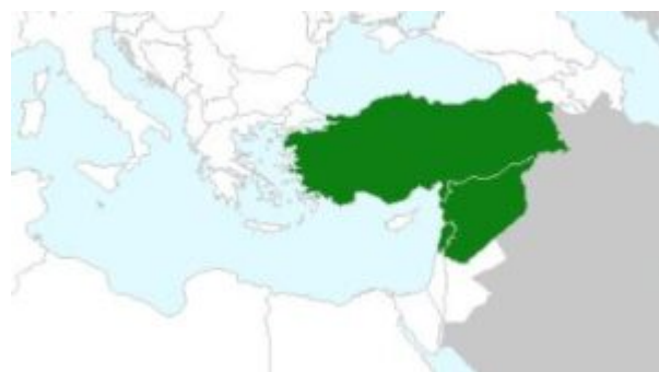
מפת התפוצה של דלעת-נחש רבת-פרחים (מימין) לשל שלעת-נחש דו-ביתית על פי אתר "פלורה אירופאה והים-התיכון" ( EU-MED data-base 2022). התפוצה של ד.נ.ר.פ. מוגבלת בתורכיה רק לחלק הדרום מזרחי ובסוריה רק להרי הלבנון ומול-הלבנון. כמו כן לא סומנה תפוצתה בהרי הטאורוס בעירק ואירן.