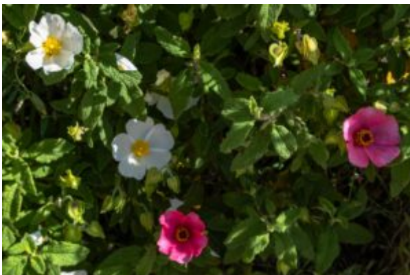
פרט הכלאיים של שני מיני הלוטם אשר נמצא בכרמל באביב תשפ"ה; לפרט הכלאיים פרח וורוד קטן יותר מהלוטם המרווני (ראה תמונה ימנית) לפני כותרת חלקים.

והנה, באביב תשפ"ה - 2025, הופתעו לראות בשולי אחד השבילים המטוילים ביותר בכרמל, שיח לוטם שיש לו תכונות ביניים בין לוטם שעיר ולוטם מרווני. כנראה שזהו בן כלאיים נדיר ביותר בין שני המינים. שיח הכלאיים גדל בתוך קבוצה צפופה של לוטם מרווני, אך במרחק מטרים ממנו פרח גם לוטם שעיר. בבדיקה של הפרי נמצא שהקשוות שלו שעירים, צבעו וורוד לפני עלי הכותרת חלקים. עד כה לא ידועה לנו תצפית דומה בכל רחבי החבל הים-תיכוני של ישראל במאה השנה האחרונות.