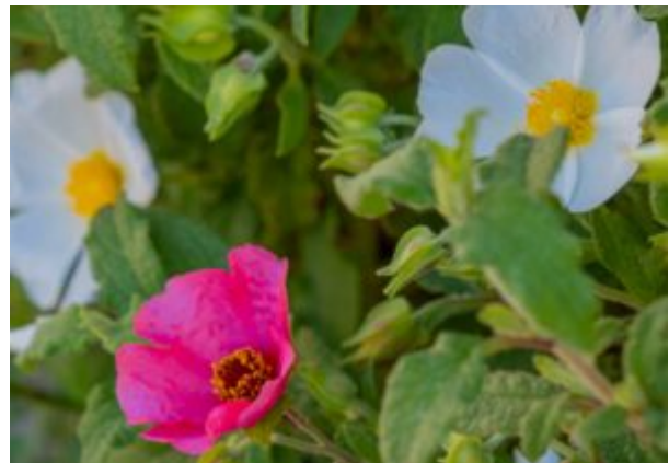
פרט הכלאיים של שני מיני הלוטם אשר נמצא בכרמל באביב תשפ"ה; לפרט הכלאיים פרח וורוד קטן יותר מהלוטם המרווני (ראה תמונה ימנית) ופניו כותרת חלקים.

בטיולנו הרבים בכרמל לאורך השנים התרגלנו להנות מפריחתם של שני מיני לוטם השונים בצבעם: לוטם מרווני הפורח בלבן, לעומת לוטם שעיר הפורח בוורוד. אמנם קל להבדיל בין המינים על-פי צבע הפרחים, אך ישנם סימנים מורפולוגיים חשובים נוספים; קשוות הפרי של לוטם שעיר שעירות ומכאן שם המין, לעומת קשוות קרחות בלוטם מרווני. כמו כן, עלי הכותרת של הלוטם השעיר דקיקים יותר ופניו מקומטות, לעומת הלוטם המרווני בו עלה הכותרת עבה יותר ופניו חלקים. ברוב עונות השנה שיחי הלוטם אינם פורחים ועל כן ניתן להבדיל בין המינים על-פי שעירות הפרי. אולם כאשר אין פירות, מה נעשה? במקרה זה