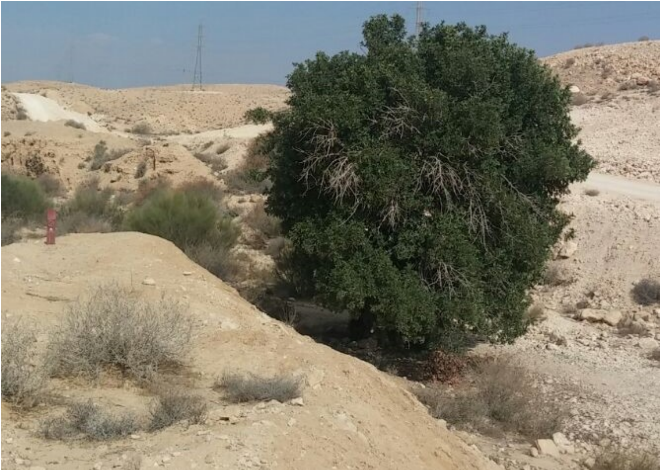
החרוב בואדי אום-חרובה ברכס בוקר. זהו חרוב נקבה עושה פירות הידוע מאז שנות השישים של המאה הקודמת. ניתן לראות את ראש העלווה שלו בנסיעה בכביש 40 קצת לאחר העליה התלולה מ"בקעת נחל בוקר, מצפון לחוות זית-במדבר.