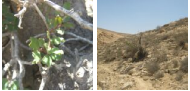
עץ חרוב מצוי Ceratonia siliqua אשר התגלה בשנת 2019 ברכס הרחמה דרומית למאבי שדה. העץ נוטה למות, רוב ענפיו יבשים, גדל בתחתית מדרון יבש בחברת נואית קוצנית, לענת המדבר ושמשון הנגב ברום 565 מטר.