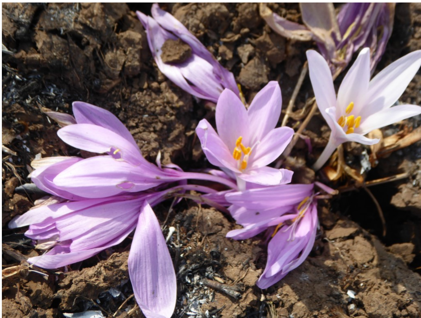
סתונית ירושלים - Colchicum hierosolymitanum בשיא פריחה בעמק המצלבה בירושלים. בפרחים הפתוחים רואים את המאבקים הצהובים - זהו הסימן העיקרי המבדיל את סתונית ירושלים מסתונית התשבץ.

אם סוכמים אנו מאות תצפיות אודות סתונית ירושלים - Colchicum hierosolymitanum Feinbrun כפי שהשתקפו בכתובים ובתמונות אשר הועלו בשנים האחרונות באתר "בוטניקה לאוהבים" ובקבוצת "כלנית כתב-עת ושיתוף תמונות" - אנו מקבלים עקומת פריחה נורמלית אשר שיאה חל בחודשים אוקטובר-נובמבר וקצותיה גולשים לחודש דצמבר ולסוף חודש ספטמבר. סתונית ירושלים הראשונה לפרוח השנה נצפתה דווקא בזעורה בצפון הגולן מעל תל-פאחר "הידוע לשמצה ולתהילה". (ש.פ. ראה תמונות). מקדימות אותה אוכלוסיות הר-חוזק (תל חזקה) אשר ממוינות בסיסטמטיקה הפורמלית כמין אחר, סתונית התשבץ , אשר עוברת באופן רציף לסתונית ירושלים עם הירידה ברום טופוגרפי בגולן (אור 19XX). השנה התחילו לפרוח סתוניות הר-ברכה וסתוניות ירושלים באותו תאריך כמעט (12.10.2023) כאשר ידוע לנו שאוכלוסיית צומת גולני פורחת אחרונה - 1.12.1992 ובתמונות של חברנו היקר אהרוני מור ז"ל בסוף חודש