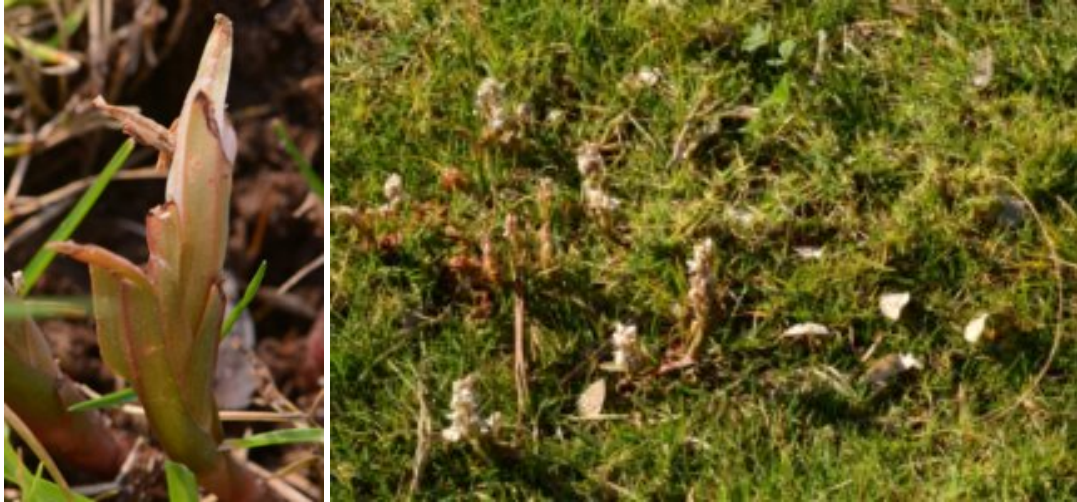
סחלב המדשאות: מימין - במדשאת קיבוץ אליפז משמאל - עלים ירוקים בבסיס התפרחת המעידים כי ס.המדשאות איננו טפיל כיוון שעליו הירוקים מטמיעים

מועדי פריחה(בצפון אמריקה): אוקטובר - ינואר ולעיתים אף אביב. בתי גידול(בצפון אמריקה): מגוונים ולחים כמו : מדשאות, צידי דרכים, משתלות, שדות חקלאיים, גדות נחלים, חממות ועוד. נציין, שזהו הסחלב השלישי שמתגלה בישראל בשנים האחרונות: רצועית קומפריה בצפון הגולן, רצועית רוברט בהרי-ירושלים ועכשיו סחלב המדשאות בדרום. אולי זה קשור להתחממות הגלובלית?