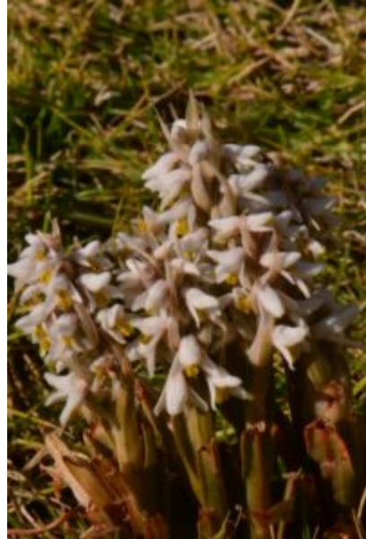
סחלב המדשאות גדל במדשאת קיבוץ אליפז בדרום הערבה, ינואר 2024