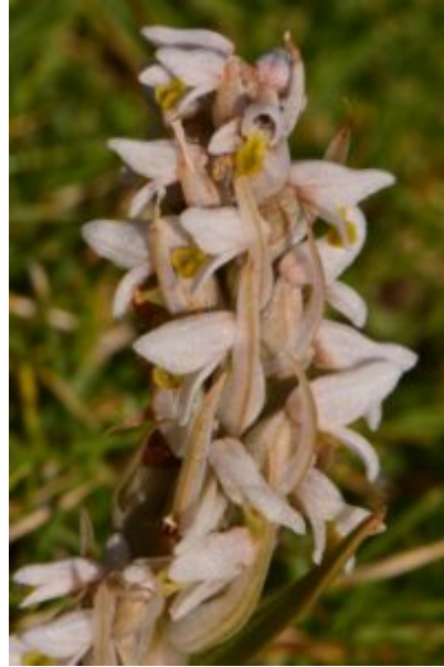
סחלב המדשאות Zeuxine strateumatica :

משמאל - קנה שורש וניצנים