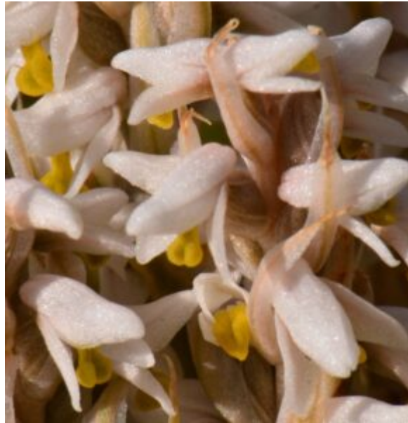
סחלב המדשאות Zeuxine strateumatica : מימין פרחים מקרוב (השפית צהובה) שמאל: A - הצמח, B - הפרח, C - השפית, D - עמודון מבט מהצד, E - עמודון מבט דרוזלי, F - זוג אבקיות (Hussainand 2023)