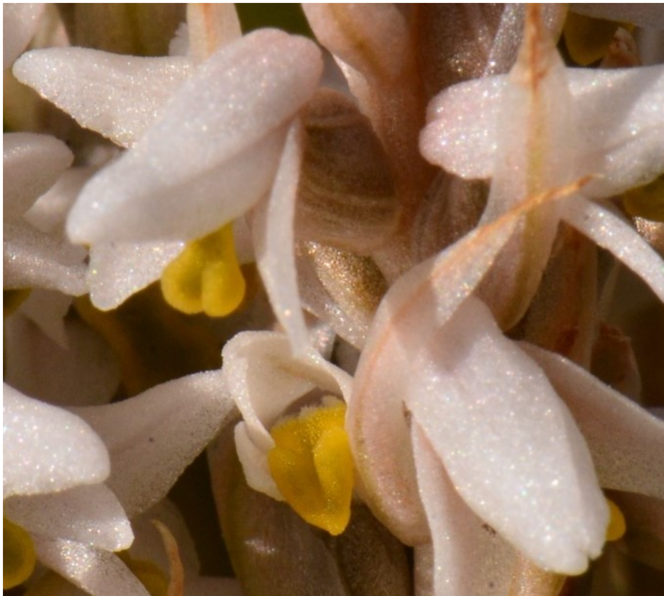
סחלב המדשאות Zeuxine strateumatica