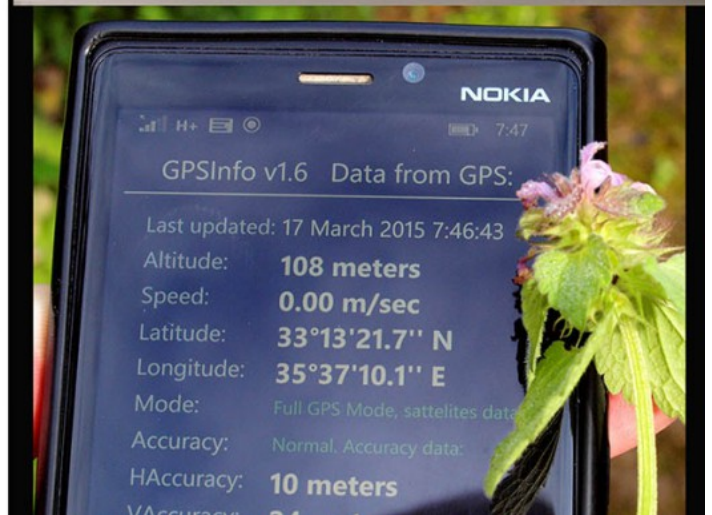
תמונה 1. נזמית ארגמנית, גיליון העשבייה ומיקום האיסוף, צילם - דרור מלמד ©