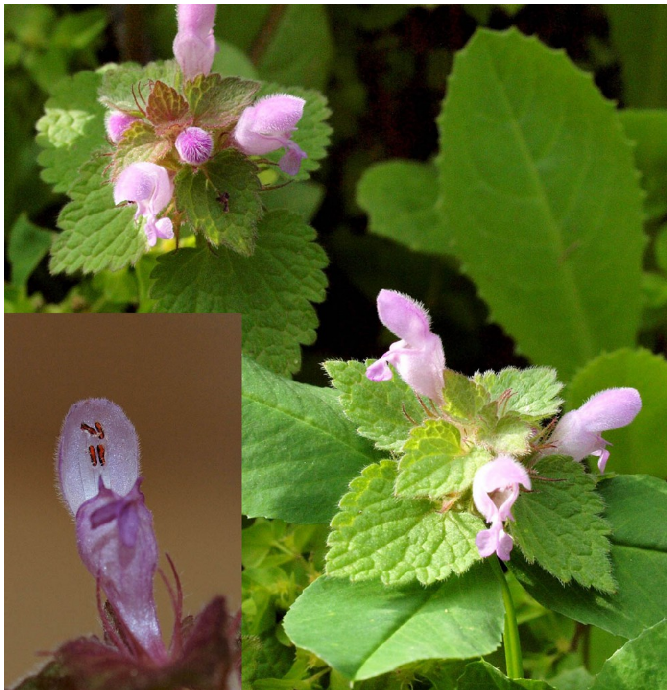
תמונה 2. נזמית ארגמנית, תפרחות ותקריב אבקנים, צילם: דרור מלמד ©