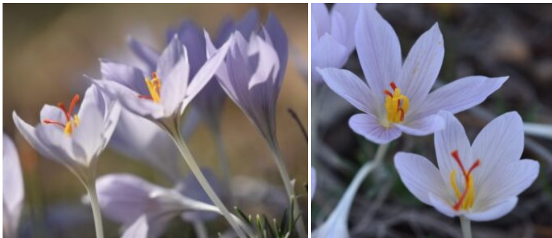
כרכום נאה (שלוש תמונות שמאליות) 21.12.23 פני-קדם רכס-הכנב

אלה, כלומר מתרחבות כלפי הקצה העליון. הכרכום התרבותי, מין קרוב מאד לכרכום נאה, תורבת כנראה בהרי פרס ובמשך תרבותו פיתח שלוש צלקות גדולות ואדומות המשמשות ליצור התבלין היקר בעולם - זעפרן. בעבר בשנות השבעים של המאה העשרים, הצלחנו למצוא שתי אוכלוסיות של כרכום נאה בהרי יהודה. האחת, מדרום לבית עומר בצומת הישנה לכרמי צור, והשניה, באזור תל זיף ועד שיך נבי-יקין ממערב לפני חבר. באזור ח' בני דר אשר ליד נבי יקין, מצא השנה ש.כ. אוכלוסיה יפה ופורחת. נדגיש כי בעוד בסקציית הצלקות המתפצלות ישנה שוות גבוהה מאד בצבע הפרחים, אורך הצלקות ומידת הסתעפותן, הרי שבכרכום נאה יש שמרנות גדולה בתכונות אלה. אולם, בהר החרמון נמצא בחגורה הטרגקנטית פרטים ל כרכום נאה עם צלקות צהובות וכתומות אשר תוארו על ידי הבוטנאי הנודע (ז"ל) פ.מוטרד, בשם - כרכום טיבו . כיוון שבאוכלוסיית החרמון ניתן לראות מוזאיקה וערבוב כמעט אקראי של פרטים צהובי צלקות, כתומי צלקות ואדומי צלקות, לא נתנו לצורה זו מעמד של מין עצמאי במחקר אשר פרסמנו בשנת 1978 (Feinbrum and Shmida 1978).