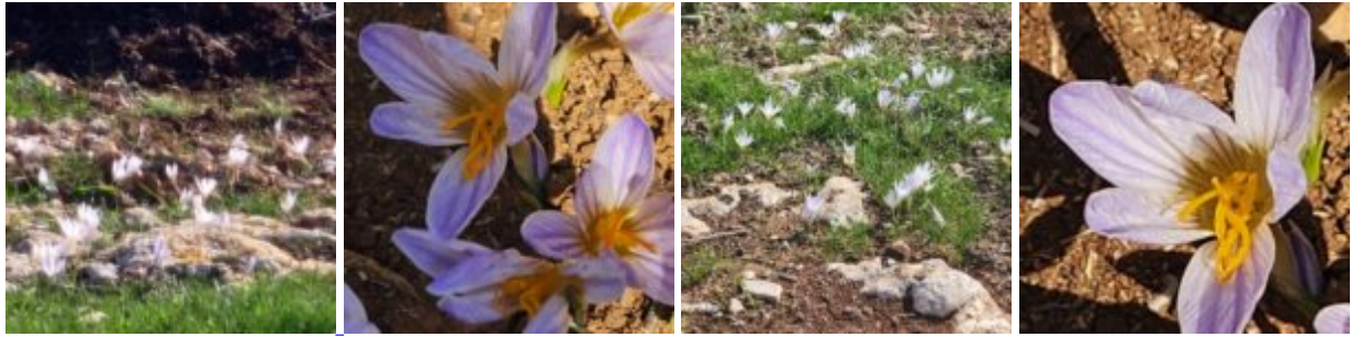
כרכום ארץ-ישראלי בעמק ברכה בגוש עציון, 4.12.23, צילם ש.כהן ©