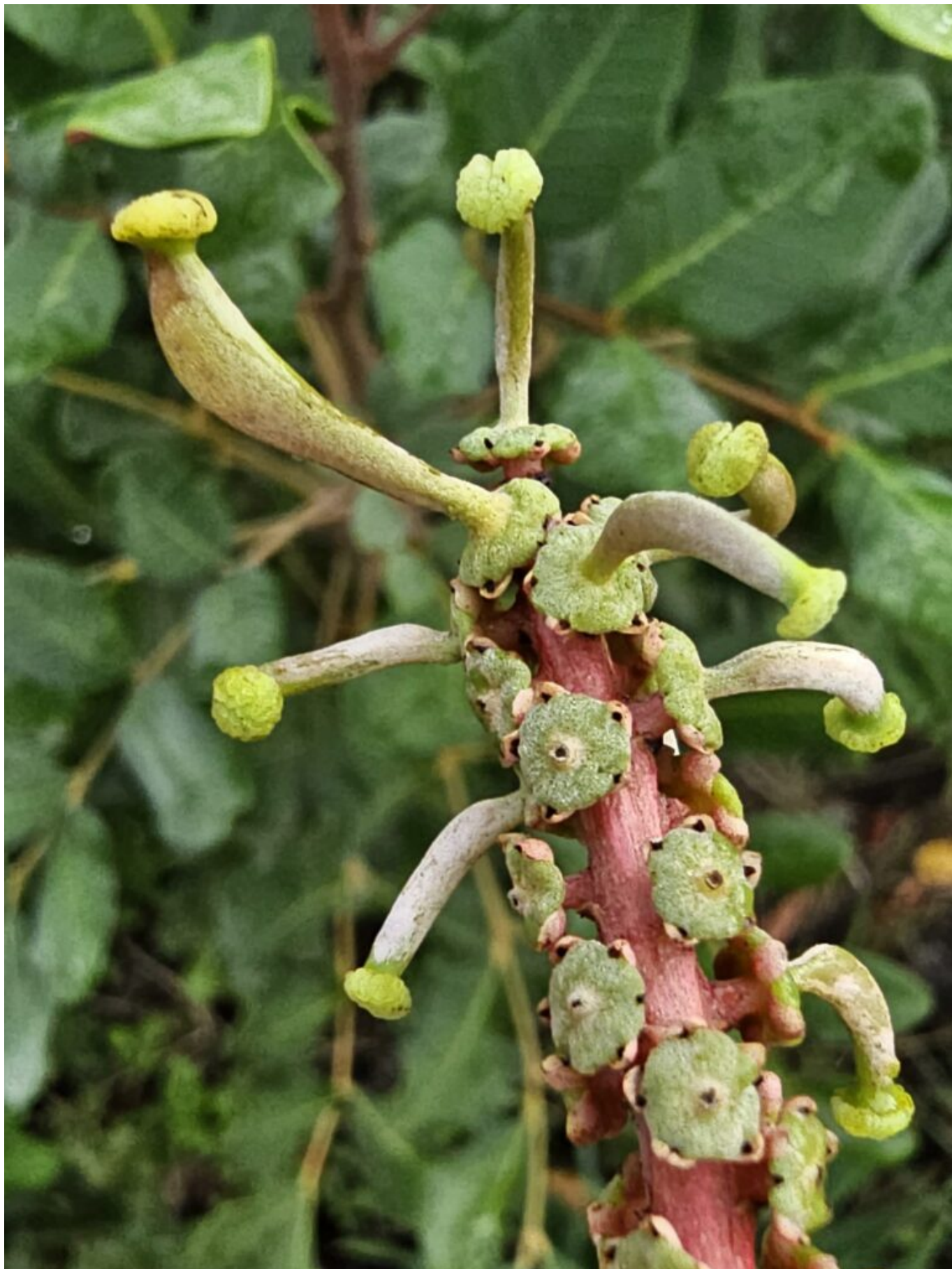
קטע תפרחת נקבי של חרוב מצוי Cerantonia siliqua . כבר בשלב מוקדם מאוד בהתפתחות העובר והשחלה לפרי מופלים חלק גדול מפרחי התפרחת. התיאוריה מספרת (נבדק בצמח שעועית אמריקאית) כי כך בוחרת הנקבה את הזכרים בעלי האון הטוב ביותר ואלה המתאימים לה בזוגיות העתידית.