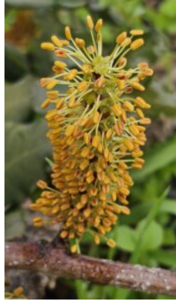
תפרחות חרוב מצוי זכרית (מימין) לעומת תפרחת נקבית, עין-חרוד, 9.12.2023, התמנות מבטאות היטב את החוק הבסיסי באקולוגיה אבולוציונית (כלל צ'רנוב(1982) לגבי ההקצאה השווה הזכרית והנקבית או כלל פישר(1930) על יחס הזוויגים השווה) - רואים כי מספר פרחי הזכר בתפרחת גדול הרבה יותר ממספר פרחי הנקבה...כי ההשקעה של הפונקציה הנקבית בפרי כה גדולה).