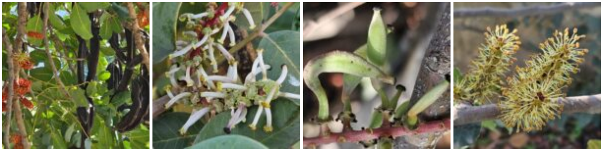
חרוב מצוי Ceratonia siliqua בגבעת קומי בשולי קיבוץ עין-חרוד איחוד. זהו עץ שהתגלה כדו-מיני והוא בעל תפרחות זכריות בצד תפרחות נקביות ופירות בשלים משנה שעברה.

הסתיו הים-תיכוני הוא המועט ביותר במיני צמחים פורחים (דפני וחב.1975); מוצאים אנו בעונה זו בעיקר פריחה של צמחי בצל וקעת (גיאופיטים) דוגמת סתונית, כרכום, נרקיסוחלמונית. העץ הבר היחידי אשר פורח בסתיו שלנו הוא החרוב המצוי, שכן רוב עצי החורש, הבתה, הספר ובתי-הגידול המופרים פורחים באביב, בין אם הם מואבקי רוח או מואבקי חרקים. החרוב, בהשוואה לשאר עצי הקטניות ניוון עד לאפס את עלי הכותרת שלו והפך להיות עץ מואבק חרקים אך גם מואבק רוח; אמוץ דפני מצא במחקר מקיף על האבקת החרוב, כי העץ מבוקר על ידי חרקים רבים אך הוא גם מואבק על ידי הרוח. דגם זה מתאים לשוק סתווי מצומק בו ישנם מעט מאוד מוכרים (הם מיני הפרחים) אך גם מעט מאוד חרקים מבקרים. שאלה שלא פתרנו היא - מדוע אוכלוסיית החרובים בגבעת קומי צמוד לקיבוץ עין-חרוד איחוד פורחת בחודש דצמבר? על כך נצטרך לעקוב בשנים הבאות ואולי נמצא פיתרון?