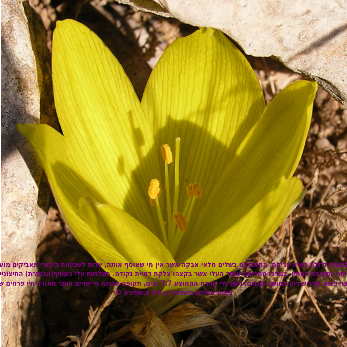
חלמונית גדולה בשוא פריחה. המאבקם בשלים מלאי אבקה אשר אין מי שאוסף אותה, עדות לשכיחות ביקורי מאביקים מועט ביותר בתקופת הסתיו. במרכז מתרחם עמוד העלי אשר בקצהו צלקת דמוית נקודה. בשלושת עלי העטיף(הכותרת) החיצוניים מצוי פוטם מפרש ריח המושך זנבאים. משך חיי הפרח הממוצע 7.7 ימים, תקופה ארוכה פי שניים ויותר מאורך-חיי פרחים של זניחה אחרים בישראל