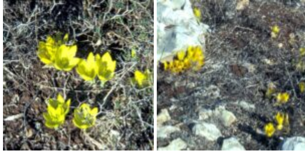
שדה חלמונית גדול פורח באתר איתרי בשנת 1992