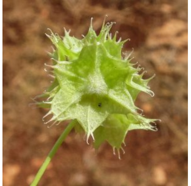
ולריינית מצויצת. מימין - פירות ירוקים; משמאל - פירות יבשים

ולריינית מצויצת יכולה להיקרא "מלכת הולרייניות" של ישראל שכן הפרי שלה הוא הגדול ביותר מבין 13 מיני ולריינית הגדלים בישראל; הפרי גדול פי שניים מזה של המינים הקרובים לה סיסטמטית - ולריינית עטורה וולריינית מאוצבעת . אונות הפרי אשר מקורן בגידולים של הגביע הפורה המכיל את הזרע, מכונפים, מצויצים ומרושתים. לפרי צורת כוכב בעל שש כנפיים רחבות, כאשר כל כנף מסתיימת ב- 3-5 קרסים (ציציות). הפירות ירוקים בראשית התפתחותם אך בהתייבשם הם הופכים לקרומיים ונחשפת אז רשת של עורקים כהים. ולריינית מצויצת פורחת באביב המוקדם (מרץ) ומתייבשת כבר בתחילת אפריל. בזכות הפירות הקרומיים המרושתים היא בולטת מאוד בשטח. מבחינה סיסטמטית ולריינית מצויצת קרובה ל ולריינית עטורה ול ולריינית קוטשי , אך היא נבדלת בכך שהגביע שלה שעיר.