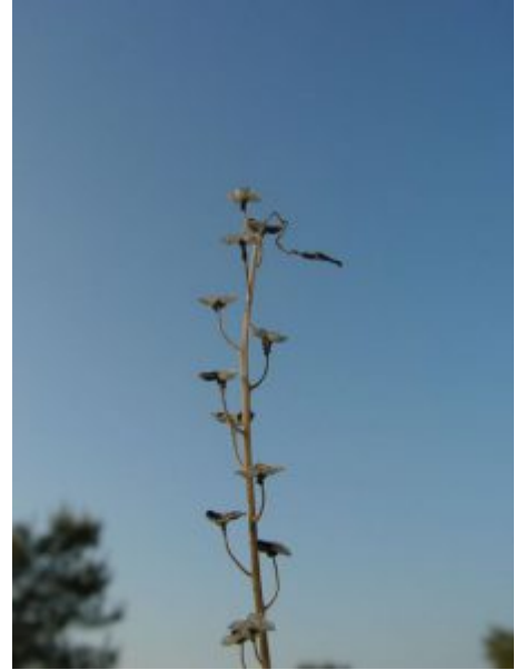
בן-חצב סתונוני. מימין - הפצת זרעים בתחילת ינואר; משמאל - קשוות ההלקט הקרומיות נשארות לאחר הפצת הזרעים להבדלה - לחצו על התמונות

העלים גדלים בשושנת, אך בדרך כלל הם זקופים או אלכסוניים. העלים צרים (כ 1 עד 3 מ"מ רוחב) עגולים בחתך רוחב ואורכם 5 עד 10 ס"מ. הצמח מנצל את חומרי המזון הנוצרים בעלים ואוגר אותם בבצל קטן וכדורי (קוטרו כ 2 ס"מ) הטמון קרוב לפני האדמה. הבצל עטוף במספר קליפות המכילות רעלנים שמטרתם להגן על הבצל מפני אכילת בעלי חיים. הבצל משמש כמקור המזון לפרחים ולזרעים של השנה הבאה.