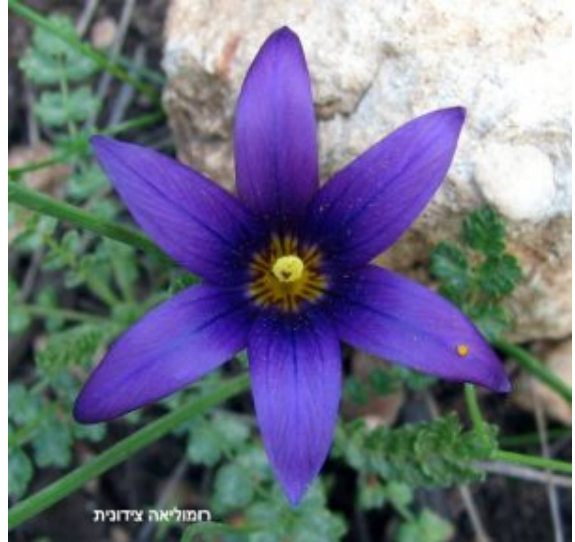
רומולאה צידונית. בתמונה השמאלית - אבקנים וצלקות בשלים.

על אף שהפריחה הנהדרת של רומולאה צידונית נצפית כל שנה, מאתנו איננו יודעים אם ברומולאה צידונית מתקיימת התופעה של "היפוך פריחה": האם האוכלוסיות הראשונות לפריחה הן אלה הגדלות ברום נמוך (כמו למשל אלה ליד מערת המיש בזכרון יעקב, או במוצא נחל נשר) או דווקא אלה הגדלות ברום גבוה (למשל בגבעת ההגנה, ברום הכרמל או בהר שוקף)? בגיאופיטים הסתויים רבים קיים היפוך פריחה כאשר האוכלוסיות הגדלות בהרים פורחות קודם לאלה הגדלות במעונות הנמוכות. איננו יודעים גם מהו הכלל של סדר הפריחה באיריס הסרגל, איריס הלבנון ונץ-חלב אזמלני. התשובה תינתן רק מתצפיות שדה סדירות ושיטתיות של חובבי הטבע!