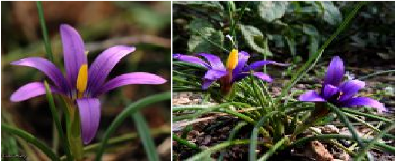
רומולאה צידונית בראש נחל נדר.

אחת מאיתנו (אראלה הרי) צילמה ב-18.1.2017 את הפרחים הראשונים הפתוחים בכרמל. זהו עיכוב פריחה של חודש ימים לפחות בהשוואה לשנים קודמות. על הסיבות לעיכוב הפריחה בצמחי גיאופיטים רבים וגם בצמחים חד-שנתיים ראו בסיכום השתלמות כלנית בכרמל .