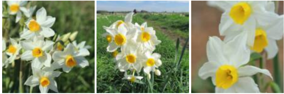
נרקיס מצוי Narcissus tazetta .

אמוץ דפני אשר חקר את הביולוגיה של ההאבקה בנרקיס מצוי בישראל ( Arroyo and Dafni 1995 ) מדווח כי בצפון הנגב גדל טיפוס הדיסטילי גבוה האבקנים, כלומר המורפ שבו שלושה אבקנים בולטים מצינור הכותרת ועמוד העלי נחבא בתוך צינור הפרח. טיפוס זה פורח בחבל הים-תיכוני ההררי בחודש נובמבר וברכסי הנגב הצפוני בסוף חודש דצמבר ולאורך חודש ינואר. טיפוס זה מבוקר בחבל הים תיכוני על ידי זבובים ומאביקים קצרי חדק אשר אוכלים את אבקת הפרח. מעניין מי מבקר באוכלוסיית הנרקיסים בנגב? ואולי כיוון שהאוכלוסיות מקוטעות וקטנות יש להן יכולת של האבקה עצמית? שאלות אלה נפנה לחובבי הטבע הפוקדים את נרקיסי הנגב כל שנה ובדבקות רבה - אנא, שימו עיניכם בפרחים, בדקו אם רק הטיפוס ארוך האבקנים גדל בהרי דימונה, נחל חצף ורכס הרחמה? ומי הם החרקים המבקרים בפרחים והאם יש ביניהם מאביקים ארוכי חדק (כמו למשל רפרף הדבקה שמצא אמוץ בצפון)?