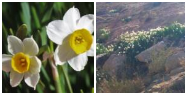
נרקיס מצוי Narcissus tazetta .

מספר אחד מאיתנו (ש.כ.) על גילויים מחדש של נרקסי נחל מסעד: