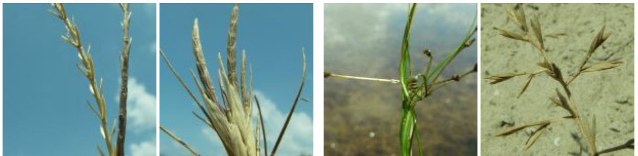
מימין לשמאל - חולית החוף, רופיית הים, דק-זנב מכונף, דק-זנב נימי. להגדלה - לחצו על התמונות

דק-זנב מכונף ( Parapholis marginata ) צומח על החול בעיקר באזורים חשופים מצמחיה אחרת. בשנתיים האחרונות נעקרו בסביבה שטחים גדולים של צלקנית נאכלת וצלקנית החרבות (ובחלק מהשטחים שנחשפו משגשגת טיונית החולות ( Heterotheca subaxillaris ), ונוצר מרחב להתרבותו של דק-זנב מכונף .