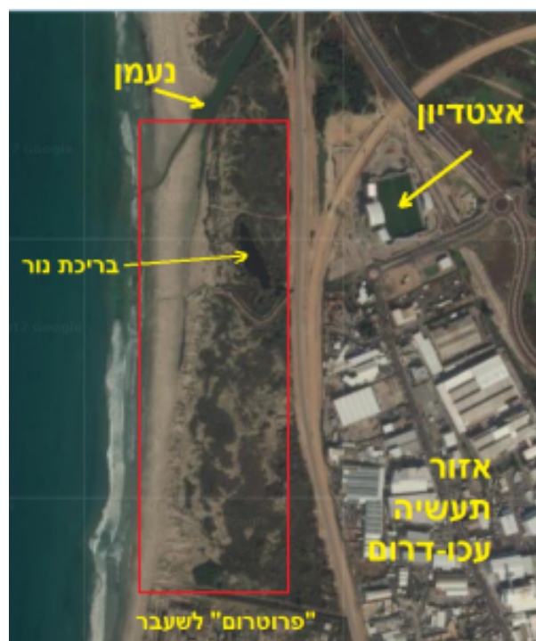
החוף מדרום לשפך נחל הנעמן