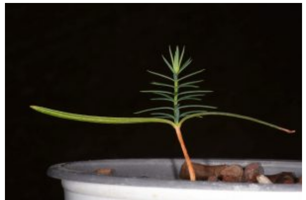
נבט של ערער גלעיני שנבט לאחר שנתיים וחצי. להגדלה - לחצו על התמונה

כדאי לבקר במשתלת הגן וסביבתה, הם כלולים במסלול המבקרים בגן ושם תוכלו לראות את הצמחים בשלבי גדילה שונים וגם אוספי צמחים השתולים במיכלים. אל תפספסו את פינת צמחי החודש, שם פורחים צמחים מיוחדים שחלקם אינו שתול בשטחי הגן הבוטני.