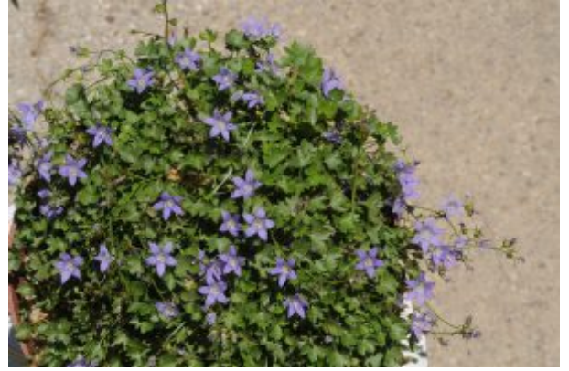
מימין - פעמונית הצלצל משגשגת בעציץ משמאל - תרמיל נפתח של צלען הגליל