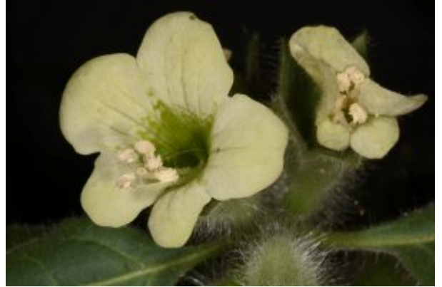
פריחת שיכרון לבן נמשכת כל הקיץ בהשקיית טפטפות.