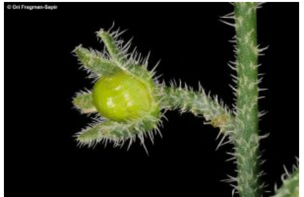
גביע של לשון-שור נגבית ובו פרודה.