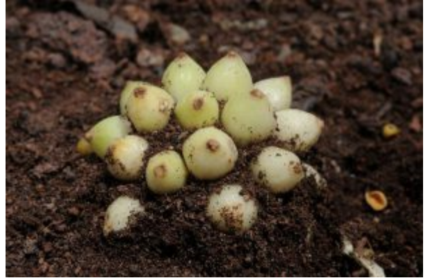
מימין - פירות של אחילוף צר-עלים Biarum angustatum ; משמאל - פירות של אחילוף החורן Biarum auraniticum