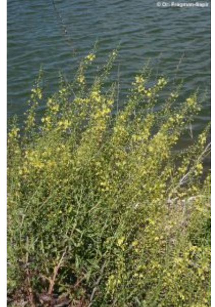
בוצין שונה-עלים. צילום: