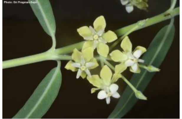
מימין - מסמור סיני בחממת הגן; משמאל - זון רב-פרחים. להגדלה - לחצו על התמונות

בשטח בור של הגן מעבר לכביש בזק, מצא דר בן-נתן כתמים של זון רב-פרחים , צמח נדיר מאד שלא ברשימת האדומים ולא היה מוכר עד כה בהרי יהודה. בעונה זו אנו אוספים את הזרעים שלו כדי לשמרו לשנים הבאות.