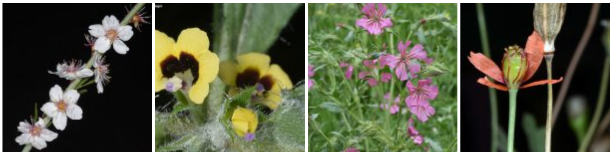
מימין לשמאל - פרג סיני; ציפורנית חדת-שיניים; שיכרון פעוט; שקד ערבי. להגדלה - לחצו על התמונות

פרג סיני וציפורנית חדת-שיניים , שני צמחים אדומים, מהווים אתגר במשתלה, רוב הזרעים שלהם לא נבטו תחת טיפולים שונים, מעט מאד כן נבטו לנבטים שרובם קרסו ולא התפתחו. הנבטים הבודדים שכן שרדו, התפתחו לצמחים גדולים ועליהם פירות רבים שפיתחו מאות רבות של זרעים טריים. בשנה הבאה ננסה טיפולי הנבטה נוספים כדי לפצח את סוד ההנבטה של הצמח. ציפורנית חדת-שיניים היא הציפורנית החד-שנתית המרשימה ביותר בארץ ולדעתנו ניתן יהיה להשתמש בה לנוי כמו במינים חד-שנתיים מקומיים אחרים.