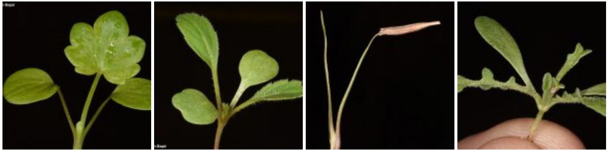
מימין לשמאל - נבט זגיאה ארגמנית; נבט זקן-תיש צהוב; נבט מחרוזת קשתית; נבט נורית הזיזים. להגדלה - לחצו על התמונות

החממה הטרופית בגן שוקמה ונבנתה מחדש, היא נשתלה מחדש לאחרונה ועדיין אינה פתוחה לקהל הרחב. כשני שלישי משטחה מיועד לצומח הטרופי, השליש הנותר מציג את המדבר. התצוגה בחממה היא תצוגה אקולוגית המנסה לחקות נופי צומח המשתנים בהדרגה מאזורים גשומים המופרים בשטחי חקלאות לאזורים יבשים. בשטחה משולבים גם צמחי מדבר ישראליים, בדגש צמחים תרמופיליים (אוהבי חום) נדירים של נאת עין גדי. מאורון יעקב, קיבלנו בחורף שתיל של מסמור סיני שנבט מזרעים שנאספו בכביש 12 בנגב הדרומי, הצמח הקטן לא גדל רוב החורף, אבל מאז שהוכנס לחממה המחוממת גדל במהירות ועליו מאות פרחים וגם פירות (עדות להאבקה עצמית!). צמחים נדירים אחרים המשגשים החממה הם גרויה שעירה , אצבוע ים-המלח , גומא פפירוס ועוד.