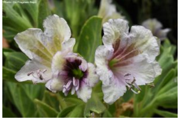
מימין - שיכרון סיני; משמאל - איריס קירקווד. להגדלה - לחצו על התמונות

את כל העבודה הבוטנית-גננית הזו מבצעים אנשים רבים בגן. מתנדבות חדר הזרעים מנקות את הזרעים ושולחות אותם ליחידות הגן או לגנים אחרים בארץ ובעולם, עובדי המשתלה ומלגאי גיבון מחו"ל זורעים ומגדלים את הצמחים וצוות הגננים שותל ומגדל את הצמחים בשטח הגן. כל יחידות הגן מלוות במתנדבים שבלעדיהם לא היינו יכולים לבצע את המשימות הללו. מי שרוצה להתנדב בגן או מכיר מישהו המתאים להתנדבות כזו מוזמן ליצור קשר עם אגודת ידידי הגן הבוטני בטלפון 02-6480049 בשעות 9:00-13:00 או באימייל friends@botanic.co.il