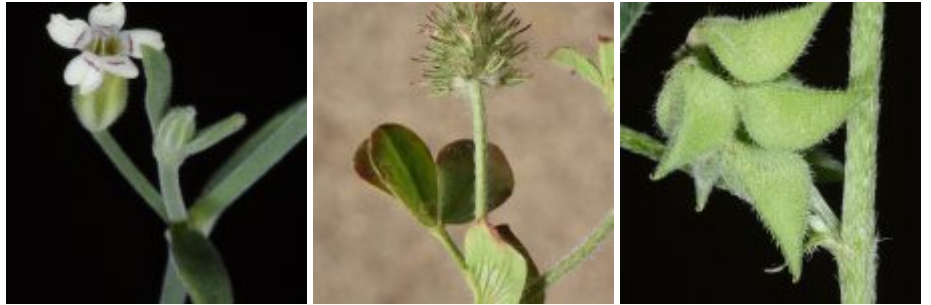
מימין לשמאל - קדד זעיר; תלתן היערות; בולנתוס דק-גבעולי; פעמונית צידונית. להגדלה - לחצו על התמונות

פרג סיני וציפורנית חדת-שיניים , שני צמחים אדומים, מהווים אתגר במשתלה, רוב הזרעים שלהם לא נבטו תחת טיפולים שונים, מעט מאד כן נבטו לנבטים שרובם קרסו ולא התפתחו. הנבטים הבודדים שכן שרדו, התפתחו לצמחים גדולים ועליהם פירות רבים שפיתחו מאות רבות של זרעים טריים. בשנה הבאה ננסה טיפולי הנבטה נוספים כדי לפצח את סוד ההנבטה של הצמח. ציפורנית חדת-שיניים היא הציפורנית החד-שנתית המרשימה ביותר בארץ ולדעתנו ניתן יהיה להשתמש בה לנוי כמו במינים חד-שנתיים מקומיים אחרים.