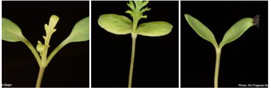
מימין לשמאל - נבט ציפורן הלבנון; נבט קחוינה חרמונית; נבט דו-כנף ריחנית; נבט שלמון דק. להגדלה - לחצו על התמונות