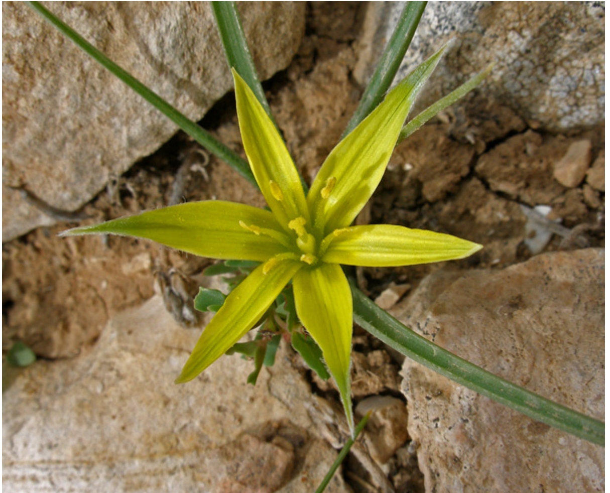
זהבית השלוחות, פרח דו-מיני, הר-הטייסים