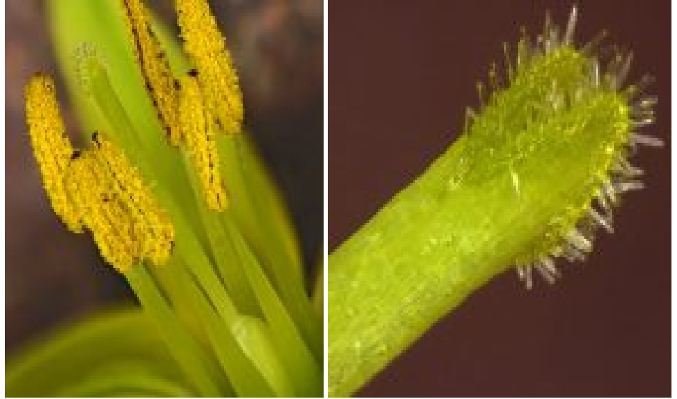
משמאל: צלקת שעירה של זהבית השלוחות, הר-הטייסים, צילם עוז גולן © מימין: פרח דו-מיני של זהבית השלוחות, הר-הטייסים, צילם עוז גולן © לצפייה מיטבית - לחץ על התמונה

טיפוס מיניות זה שכיח למדי בצמחים, לדוגמא בסוג צלף , בעץ ערמונית הסוסים ( Aesculus hippocastanum ) ושכיח מאוד בסוגי דגניים כמו שעורה , ברומית , שעלב ו סיסנית ). עם זאת, השיעור של דגם המיניות החד-ביתי זכרי בתוך כלל הצמחייה של ישראל או העולם הוא קטן ( שמידע וכהן, 1983). בכל המקרים הפרחים הזכריים בטיפוס מיניות זה מופיעים בסוף עונת הפריחה של הפרט או בפרטים קטנים הנתונים לתנאי עקה (Dafni and Shmida, 2002). ההסבר האקולוגי-אבולוציוני להיווצרותו קשור להבדל בהשקעה הזכרית לעומת ההשקעה הנקבית: ההשקעה בפרי גדולה מאוד לעומת ההשקעה ביצירת אבקה ודורשת הרבה יותר משאבים (החישוב נעשה לפרח) ולכן צמח שיש לו משאבים מועטים או נמצא בעקה "יעדיף" (אם אפשרי) אצלו מבחינה מורפולוגית אבולוציונית) לייצר רק פרחי זכר ואילו בתנאים "נורמליים" טובים הוא יגדל פרחים דו-מיניים בעלי אברי נקבה שיש להן מספיק משאבים כדי ליצור את הפירות שייצורם יותר יקר ומצריך יותר משאבים. דגם של רב- צורתיות (פולימורפיזם) בטיפוסי מיניות ו"סקס גמיש" המשתנה בצמח מסוים בהתאם לתנאים - קיים גם בסוגי עצים כמו אורן , ברוש ו אלון שבהם נצפתה חד-ביתיות זכרית. דגם כזה קיים גם באלמוגים, ובבעלי חיים רבים נוספים (שמידע, 1994).