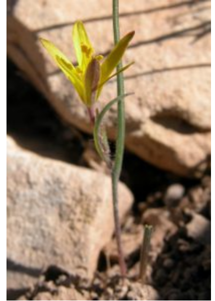
מימין: פרח זכרי של זהבית דמשקאית, מעל פטרה, משמאל: פרח דו-מיני של זהבית השלוחות, הר-הטייסיים, לצפיה מיטבית - לחץ על התמונה