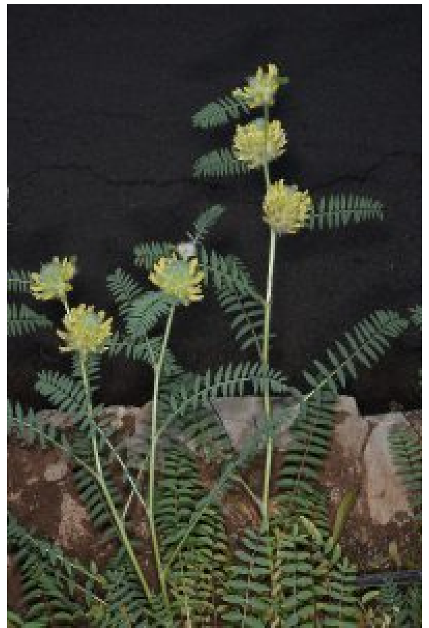
מימין - קדד הקרקפות בגן הבוטני בגבעת רם; משמאל - זגיאה ארגמנית פורחת בגן הבוטני בגבעת רם.

הצמח האחרון עליו נספר הוא זגיאה ארגמנית Zoega purpurea (מורכבים), צמח חד-שנתי מדברי עדין שנמצא בארץ באתרים ספורים בלבד. בהיותו צמח בסכנת הכחדה, ביקשנו מבנק הגנים במכון וולקני לקבל זרעים שלו. הזרעים הועברו אלינו, נזרעו והתפתחו לצמחים פורחים. לא ידענו מה מראה התפרחות, היות ויש עליו בארץ תיעוד מזערי ולא קיימים צילומים טובים שלו. הצמח אינו מרשים במראה כללי, אולם התפרחות העדינות שלו ארוזות בחפים מנוצים מיוחדים ויפים, ואלה נראים רק בצילומי תקריב כמו זה המופיע כאן.