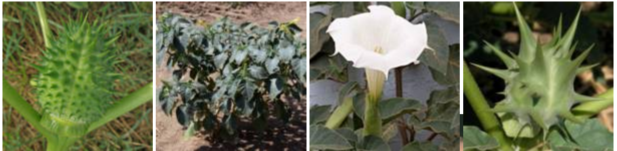
דטורה נטוית פרי, צילומים: ערגה אלובי © ועוז גולן ©

להלן מכתב של אורי אליאב לטודונט א.ש. ובו צירף את ידיעותי אודות שימושי הדטורה: "ב'ה' (טירת צבי, 25.8.81) מצורף כמה מילים על שימושי הדטורה אצל הפלחים בעמק בית-שאן. אלה דברים שנפגשתי עמם בשטח. כמובן יכול להיות שבמקומות אחרים יש שימושים אחרים כנתיים אחרים לאותו הצמח. יש השתמשתי בשום ספר ואם הדברים כתובים כבר (בהחלט אפשר!) - הריני מבקש את סליחתך. יש אפשרות ששני אנשים, בו זמנית יכתבו על אותו נושא מבלי שהאחר יודע מחברו. [שוב באה הדגשה כמו בכתבה] - מעניין שהפלחים אינם מכירים את דטורה זקופת-פרי. האם זה ניאופיט? שכן דטורה נטוית-פרי גדלה בעיקר בשדות כותנה - גידול חדש יחסית בעת הזו [ נכתב בשנת 1981 על התקופה של 1945-1980]. את המילים על הדטורה כתבתי לרן(א.ש.) ואתה יכול לתקן, לצנזר, להוסיף רוטב פיקנטי, הכל כפי רצונך. את הסיפור של תפיסתו של אבו-ג'לדה שמעתי בכפרים באזור טמון(מדרום לטובס) טאלה שזכו בפרס הספיידעו יפה את השפעת זרעי הדטורה על האדם [ כנראה מניסיון אישי]. כאשר הוא, אבו-ג'לדה נרדם הובילו את השוטרים אליו. לאחר משפט הביטחים תלו את אבו-ג'לדה בבית-סוהר בירושלים. במיטב הברכות בידודתאורי אליאב