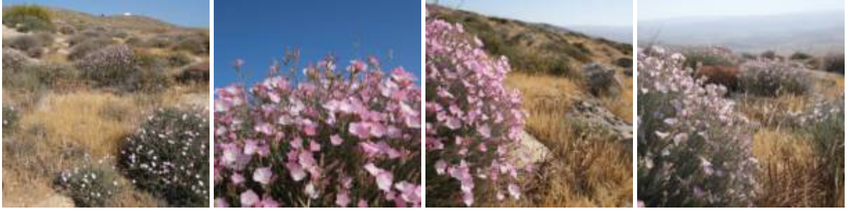
חבלבל זיתני, 26.4.21, מעלה עמשא-קריות