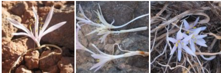
סתונית סיני Colchicum guessfeldtianum פרח בתאריך 29.11.09 ללא עלים, גבל עבס פשה בדרום סיני, צילם עמיאל וסל ©