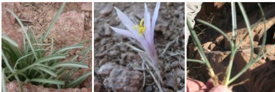
עלים קרחים של סתונית סיני מופיעים לעיתים בדצמבר אם ירד גשם ובחודש מרץ כל שנה. יש פרטים באוכלוסיה שבהם העלים בעלי שעירות ארוכה רכה הנושרת עם התבגרות העלה. במרכז: פרח סתונית סיני, פרח בתאריך 29.11.09 ללא עלים, עבס פשה בדרום סיני, צילם עמיאל וסל ©

בתאריך 13.11.2021 הורידה מערכת סינופטית של אפיק ים-סוף גשמים ברחבי דרום-סיני ודרום מערבה עד אזור סכר אסוואן במצרים. התקשורת דווחה על שטפונות עזים במצרים העליונה, אנשים טבעו ו"העקרבים יצאו ממחילותיהם" וסכנו את המצרים. בנחל וותיר אשר במזרח סיני היה שטפון גדול וגם כנראה בואדיות נוספים בדרום סיני. בטיולנו בהר הגבוה גבי המים בואדיות היו מלאים אך גשם זה עדיין לא גרם לצמיחת עלים משמעותית באוכלוסיית סתונית סיני (ראה תמונות); כלומר בצל הסתונית זקוק ליותר מאשר 3 ימים כדי ללבלב ולגדל את העלים.