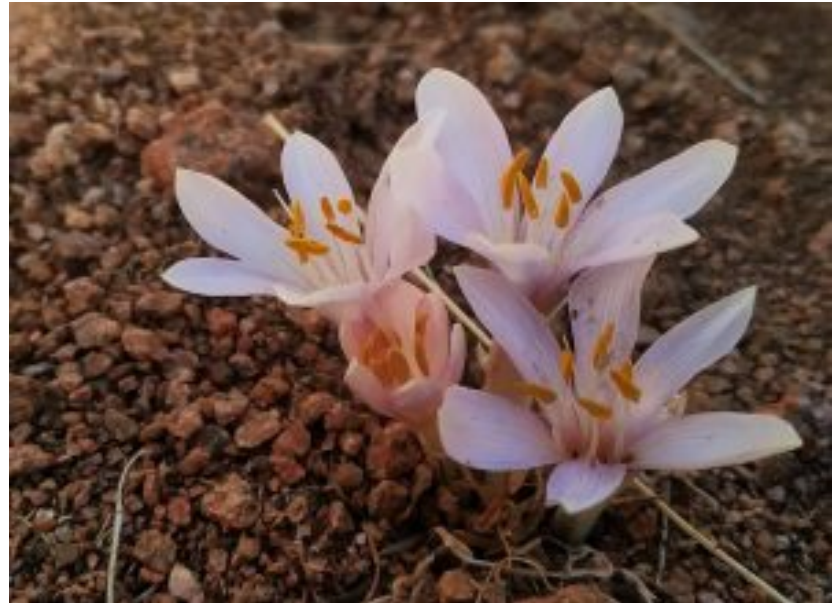
סתונית סיני Colchicum guessfeldtianum בפריחה בהר הגבוה בדרום סיני פורחת בתאריך 16.11.2021 ללא עלים

בתאריך 13.11.2021 הורידה מערכת סינופטית של אפיק ים-סוף גשמים ברחבי דרום-סיני ודרום מערבה עד אזור סכר אסוואן במצרים. התקשורת דווחה על שטפונות עזים במצרים העליונה, אנשים טבעו ו"העקרבים יצאו ממחילותיהם" וסכנו את המצרים. בנחל וותיר אשר במזרח סיני היה שטפון גדול וגם כנראה בואדיות נוספים בדרום סיני. בטיולנו בהר הגבוה גבי המים בואדיות היו מלאים אך גשם זה עדיין לא גרם לצמיחת עלים משמעותית באוכלוסיית סתונית סיני (ראה תמונות); כלומר בצל הסתונית זקוק ליותר מאשר 3 ימים כדי ללבלב ולגדל את העלים.