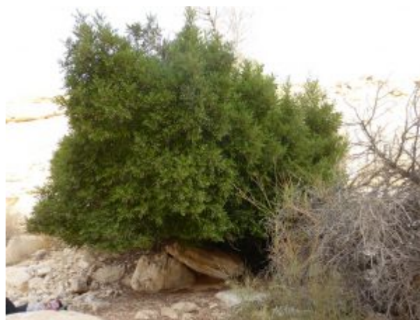
חרוב מצוי בנחל דרס.

זהו החרוב היחידי הגדל בכל אזור מזרח קמר מחמל, קמר חתירה, חצרה והנחלים הנשפכים לצפון הערבה. האם חרוב זה עושה פירות כל שנה? מהיכן הוא משיג גרגירי אבקה זכריים להפריה? העתיד יפתור את התעלומה.