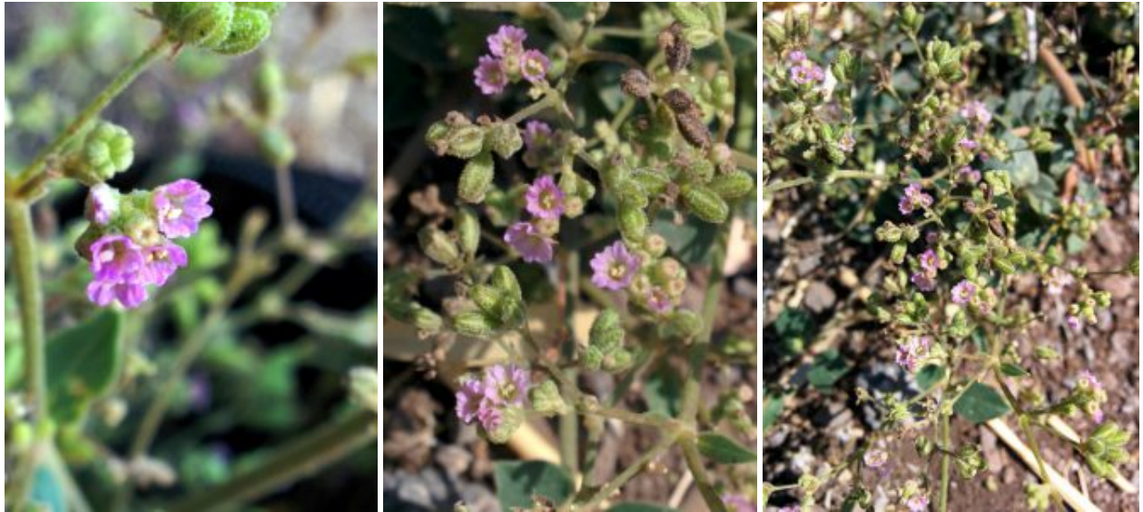
בורהביה זוחלת - מבט מקרוב על הפרחים ועל הפירות עם השערות הבלוטיות. לצפייה מיטבית - לחצו על התמונות

החידוש והמיוחד במציאה ומשמעותם לתפוצה לאקולוגיה ושמירת הטבע בורהביה זוחלת מצוינת בספר האדום (שמידע, פולק ופרגמן-ספיר, 2011) משמונה אתרים בשלוש גלילות - מדבר יהודה, בקעת ים המלח והבקעה. רוב האתרים מצויים באזור הג'יפתליק בבקעה. האתר החדש ממוקם אמנם פורמלית בגליל התחתון, אך מצוי באזור חם הגובל בבקעת כנרות ובבקעת יבנאל המצויות מתחת לפני הים. המציאה הנוכחית חשובה שכן היא מציינת גבול תפוצה צפוני חדש למין בארץ ובעולם, גבול שהיא כ-80 ק"מ צפונה מהאתרים הצפוניים שהיו מוכרים עד כה באזור הג'יפתליק. עוד חידוש המסתמן מהאתר החדש שבו התגלה הצמח הוא סוג בית הגידול: בספר האדום מצוין שהוא גדל בבתי גידול טבעיים ולא מופרים. אולם הופעתו במטעי עין גדי כמו גם בשדה החקלאי ליד פוריה, מראה כי הוא מצליח לשרוד גם במעונות מופרים. עובדה זו מעודדת, היות שניתן להניח שהמין ישרוד למרות הפרעה הנגרמת מעיבוד חקלאי. יש לציין שהוא מצליח גם כצמח בגינון של קומראן (בלכר, 1995). שני הצמחים ברמת פוריה הם גדולים ומרובי פרחים ופירות בניגוד לפרטים הדרומיים יותר. כדאי לבחון אם מדובר בשונות פנוטיפית המבטאת מתנאים משופרים של משק המים בגליל התחתון, או שיש הבדל גנטי קבוע בין פרטים אלה לבין הפרטים של הבקעה.